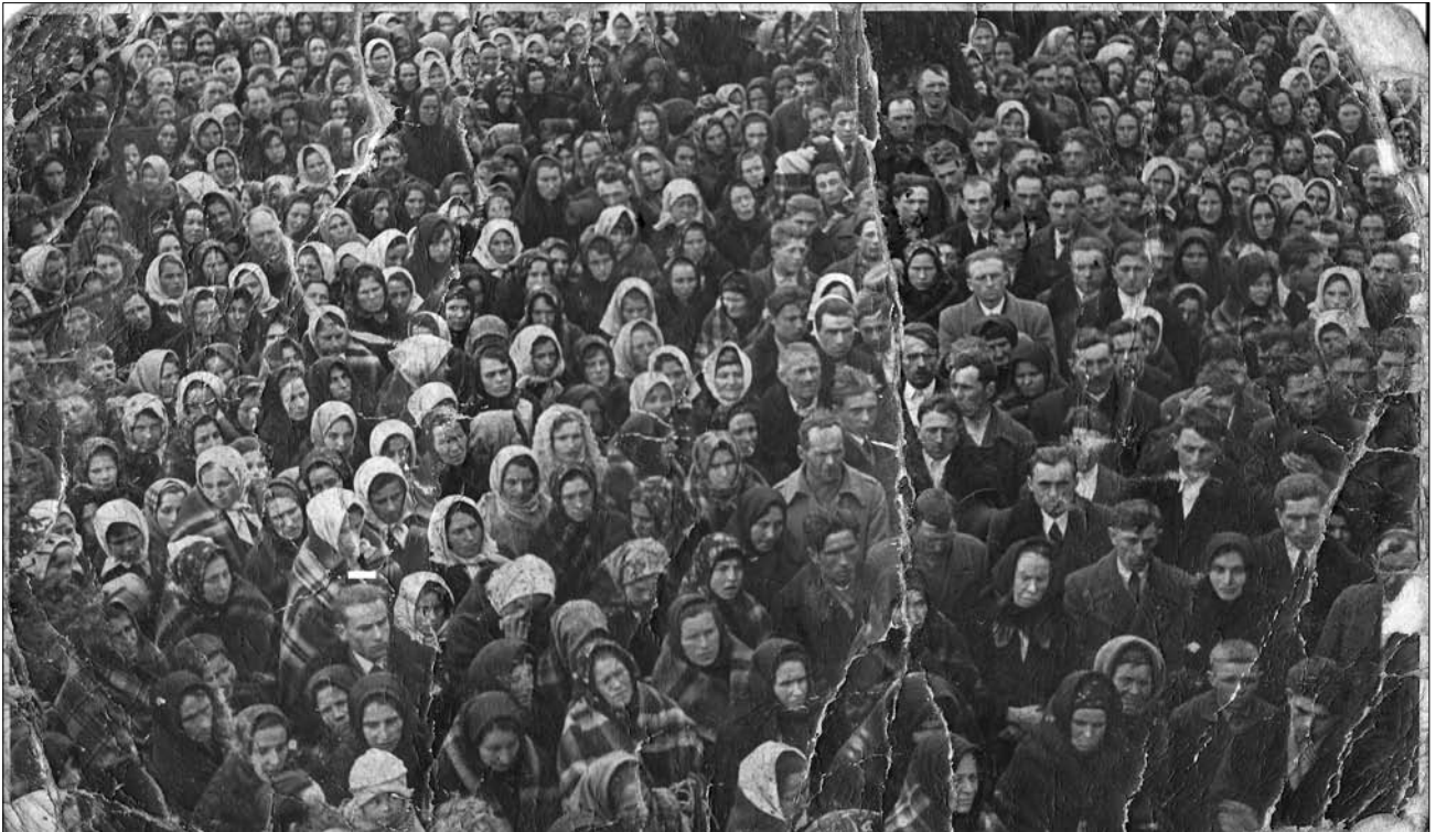
На реколекції в с. Товців. 1930-ті рр.

хоч якось компенсували відсутність Української державності, митрополит Андрей вважав за потрібне реформувати не тільки клір, але й парафіяльне життя 7 . «Обов'язки свої так розумію, що не лиш для вірних, що тепер живуть, маю з дня на день працювати й робити все, що лиш в моїй силі, щоб їх світлом Євангелія Христового просвітити. Маю обов'язки і для будучих поколінь... працю для будучности вважаю за річ сто разів важнішу як усе, що можна для хвили теперішньої зробити»[23].