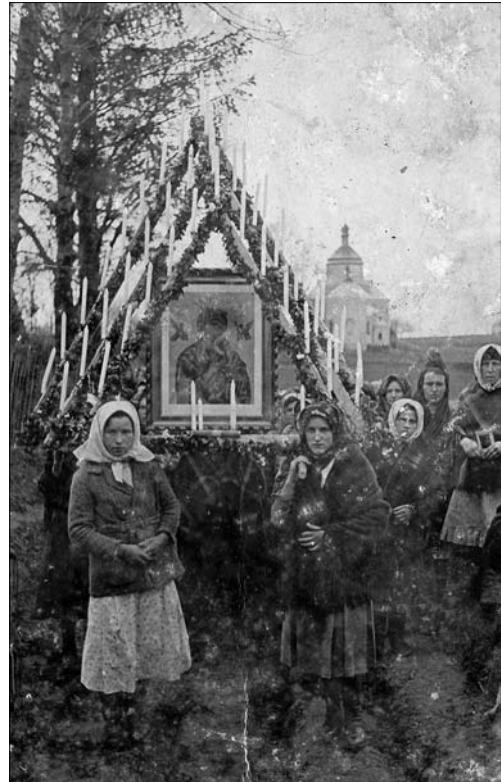
«Місія». Перенесення образу-сератону Матері Божої Неустанної Помочі до с. Селиськ. 1938 р.