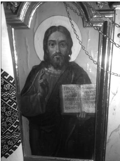
Ікона Ісуса Христа з розкритою книгою на іконостасі храму.