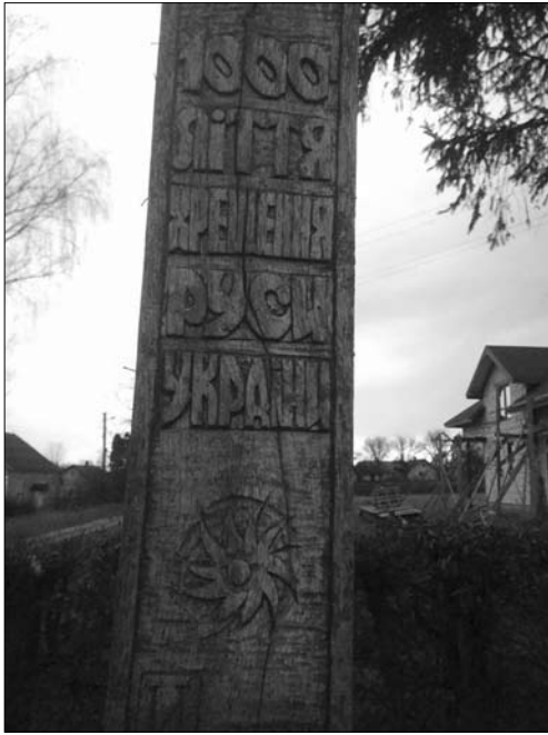
Фрагмент місійного хреста Бориса Іваніва, 1988 р.

інші сани. А дзеленчання від дзвіночків, що їх чіпляли коням на упряж. То незабутні спогади» 11 .