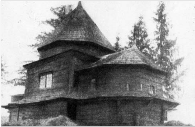
Стара церква Успіння Пресвятої Богородиці с. Товців, збудована 1796 р.