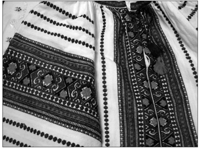
М. Стефак. Святкова сорочка. 2005—09 рр. (Ткацтво Марії Стефак — Режим доступу: https://tkactvo.webnode.com.ua/fotogalereya/#izobrazhenie-265-jpg )