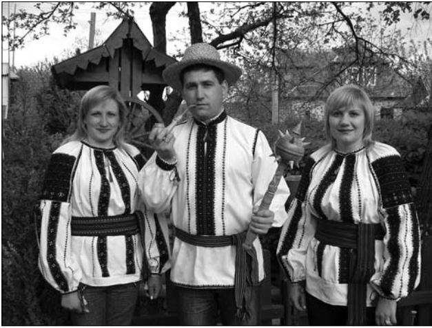
М. Стефак. Сорочки «борщівські» 2009—10 рр.