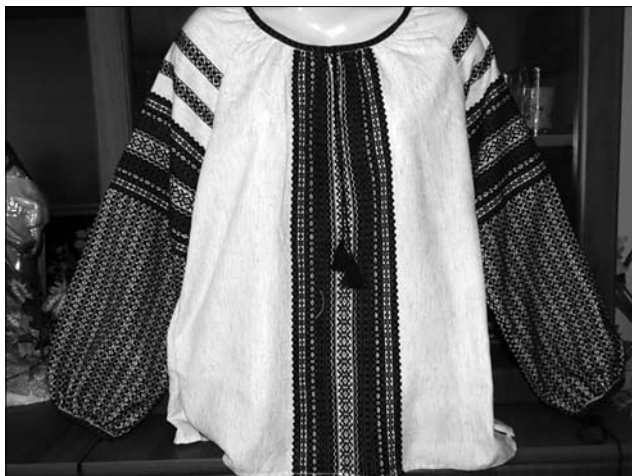
М. Костюк. Жіноча сорочка. 2005—08 рр. («Покутське ткацтво» родини Костюків — Режим доступу: http://www.ifportal.net/news/full/11690.html )