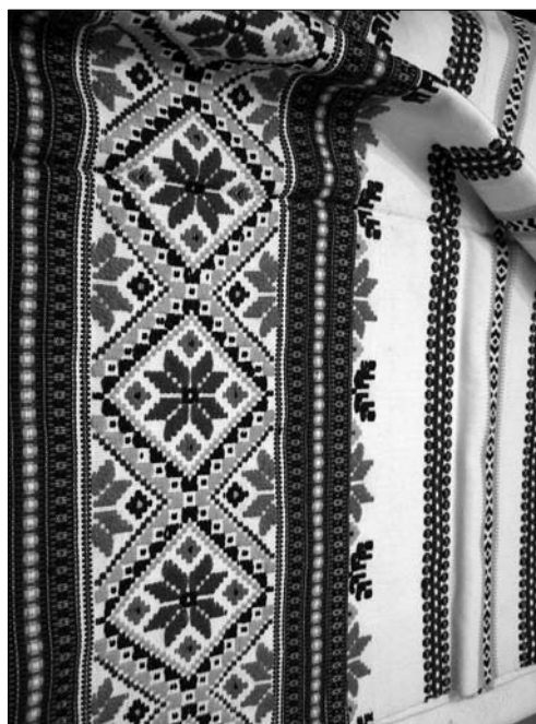
М. Стефак. Фрагмент рушника. 1990—1992 рр.

продукції регіону його твори вирізняє висока культура орнаментального вислову і м'яка гармонійна кольорова палітра, яку подекуди роз'яснюють дзвінка червона та оранжева барви (характерні снятинським тканинам). Це засвідчують численні презентації майстра на фольклорно-етнографічних заходах, виставках, а також визнання творчості музейними спеціалістами та державою.