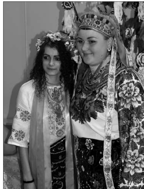
Молода з дружкою. 2015 р., с. Підвисоке Снятинського р-ну Івано-Франківської обл.

економічними, політичними умовами, ідеологічними параметрами та естетичними критеріями.