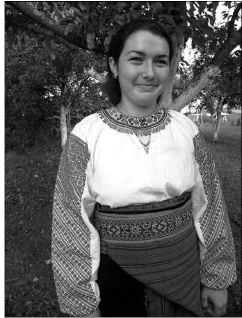
Дівчина у народному одязі. 2017 р., с. Белелуя Снятинського р-ну Івано-Франківської обл.

Метою проекту «Українське декоративне мистецтво 1990—2020-х років: етнічні смисли творчих практик» є вивчення реального стану українського декоративного мистецтва окресленого періоду та визначення перспектив його розвитку. Побудова чіткої концепції художнього процесу 1990—2020-х років, з'ясування художніх позицій митців, появи і зникнення певних художніх явищ, напрямків, видів декоративного мистецтва у зв'язку з соціально-