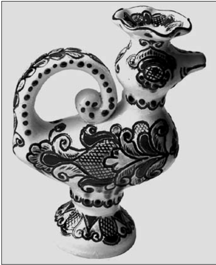
Валентина Джуранюк. Свічник «Пташка». Глина, виточування на гончарному колі, ліплення, розпис, полива. 2003 р. м. Косів Івано-Франківської обл.