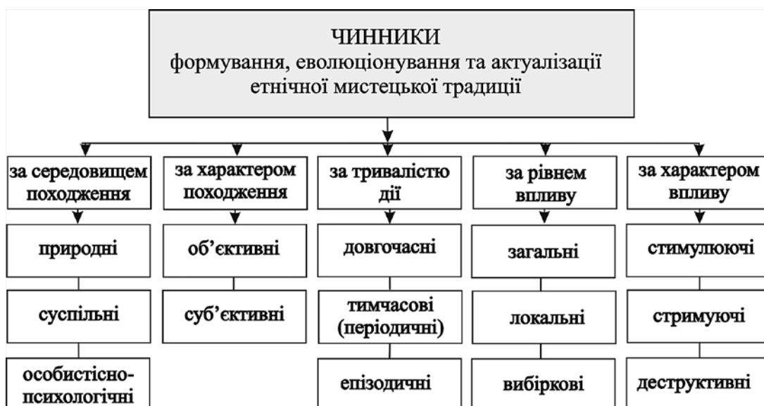
Схема 1. Чинники ФЕА етнічної мистецької традиції

Вивчення чинників ФЕА розпочнемо з їхнього упорядкування (не претендуючи на його вичерпність). До основних віднесено параметри: за середовищем і характером походження, за тривалістю дії, за рівнем впливу, за характером впливу (схема 1).