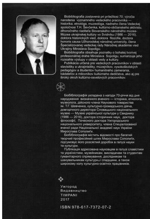
Зворотній бік книги

театвознавства, фольклористики та етнології ім. М. Т. Рильського НАН України у Києві. Це стало вагомим поступом у визнанні наукових досягнень вченого у Словаччині, Україні та Європі.