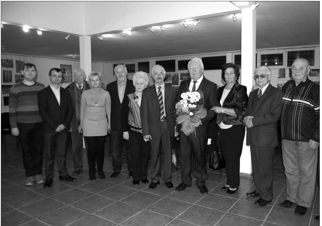
На презентації бібліографічного покажчику у Закарпатському музеї народної архітектури та побуту 30 листопада 2017 р.

Досліджуючи складові матеріальної культури, вчений не оминув вивчення скарбів народного мистецтва українців Східної Словаччини. Підсумком такої праці є публікація двох монографій автора — «Tradicie hmotnej kultúry Ukrajincov na Slovensku» (2006) та «Скарби народної культури» (2012).