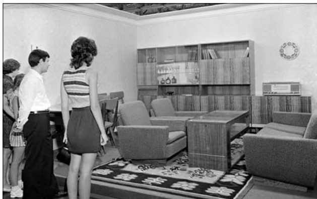
Іл. 5. Килим в експозиції меблевого гарнітуру Чернівецької меблевої фабрики на ВДНГ СРСР. 1973.