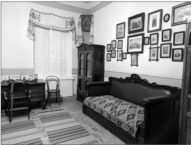
Іл. 2. Передпокій у будинку-музеї Д. Яворницького в м. Дніпрі.

го інтер'єру. Асортимент різнився залежно від призначення. Переважали килими і килимові вироби на стіну або для застеляння сидіння дивану, за відсутності настінних килимів в Україні їх часто заміняла декоративна плахтова тканина [11, с. 37]. Долівкові килими паласного типу зустрічались у номенклатурних оселях та кабінетах і вирізнялись більшим форматом та масштабнішими рисунками, їх стелили у центрі віталень. Елементом престижу стали й західноукраїнські гладкоткані килими в інтер'єрах партійної верхівки (Іл. 1) і заможних городян [20, с. 38]. Масовішими у категорії виробів на підлогу були домоткані смугасті хідники-доріжки. В житловому інтер'єрі 1930—1950-х рр. усяляко застосовувалось домашнє рукоділля. Поряд з вишитими тематичними композиціями, популярності набули