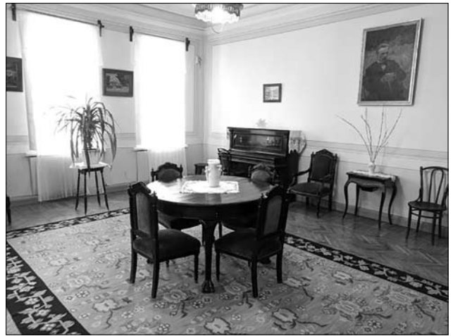
Іл. 3. Інтер'єр вітальні будинку-музею Д. Яворницького у м. Дніпрі.

Швидким змінам у побуті сприяла нова програма масового житлового будівництва в СРСР, її втіленням стали т. зв. хрущовки, параметри яких вимагали перегляду всієї дотеперішньої структури предметно-