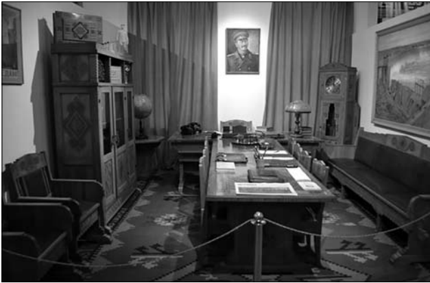
Іл. 1. Кабінет радянського партійного керівника вищого рангу. 1945—1950-ті рр. Реконструкція в рамках експозиції «Мій дім — Росія», Філіал музею сучасної історії Росії, Москва.