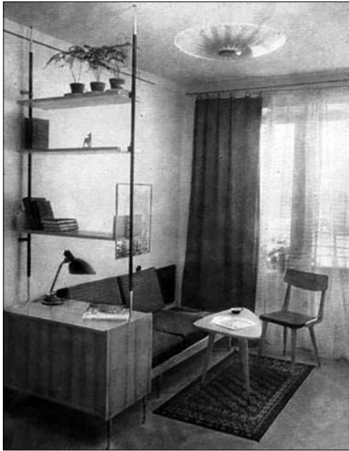
Іл. 4. Інтер'єр 1960-х рр. Джерело: https://www.liveinternet.ru/users/5168383/post385042436/