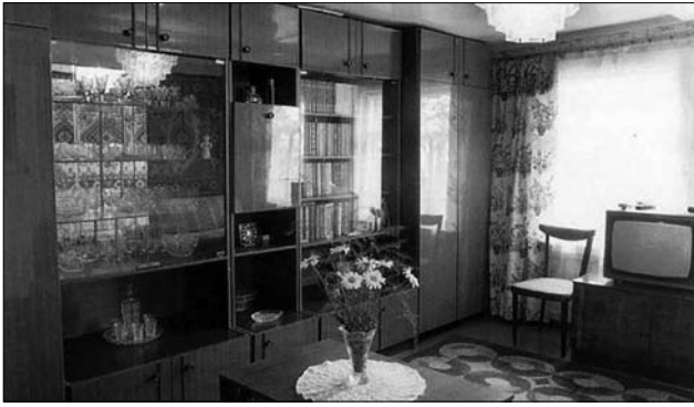
Іл. 9. Типовий меблевий гарнітур та його наповнення в радянському житловому інтер'єрі 1970-х.

лений в них національний мотив творять, передусім, килими українського виробництва (артілей та фабрик Івано-Франківщини, Львівщини, Чернівеччини, Полтавщини, Київщини). Манера ж застеляння цієї тканиною дивану та бічних крісел виявиться універсальною популярною практикою у помешканнях ще й на початку ХХІ ст. Сталою особливістю такої традиції, що склалась від 1960-х рр., можна назвати використання гладкотканих західно-українських килимів. Семантичний статус килима зазначеного стильового зразка і його функціонального призначення виявляє бажання власника перебувати у контексті своєї національної культури, не тільки споглядати (ситуація, коли килими на стіні), а й контактувати з нею (ситуація, коли килимом застелено диван), про що у т. ч. свідчить оздоба приватних помешкань представників української діаспори. Водночас, така презентація на національній основі, є варіантом засвоєння у широкому побуті ідеї смаку, як базового мотиву в офіційному дискурсі другої половини 1950—1960-х рр.