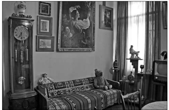
Іл. 7. Килими в інтер'єрі вітальні літературно-меморіального музею-квартири П. Тичини (Київ).