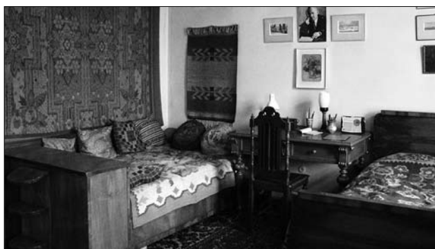
Іл. 6. Килими в інтер'єрі спальні літературно-меморіального музею-квартири П. Тичини (Київ).

валось оздоблювати будь-якими навісними деталями, крім одного-двох дрібних елементів. У проектах інтер'єрів того часу фігурують невеликого формату доліткові килими, доріжки. На тлі уніфікованих, осучаснених підходів килимові покриття вирізнялись фактурою і кольором або фактурою й орнаментом (Іл. 4), це додавало помешканню необхідного затишку, оздоби та індивідуальності.