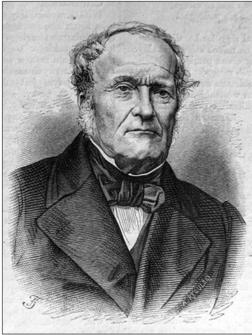
Іл. 6. Регульський О.Т., Тегаццо Ф. Портрет А. Саккетті. 1870 р., дереворит