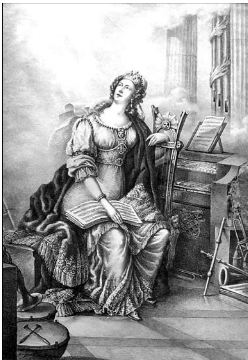
Іл. 7. Лянге А., Енгерт Й. Св. Цецилія (Кекилія). Б. р., літографія

60, s. 35]. Окремі ж зазначають, що А. Лянге малював декорації, а він лише їх розмальовував [24, s. 282]. Цьому суперечить інформація, яку подають тогочасні часописи. В історії українського мистецтва художник відомий як автор декорацій австрійського театру Львова. Надзвичайно плідним у його творчос-