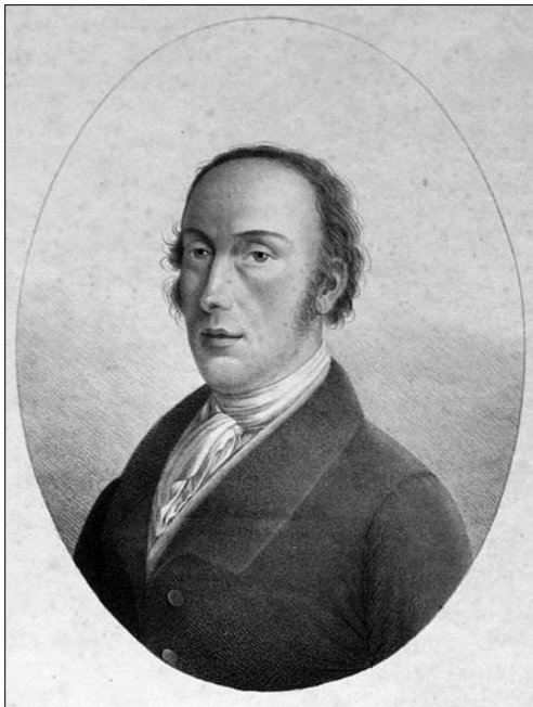
Іл. 2. Годлевський М. Портрет А. Лянге. 1840-ві рр., літографія