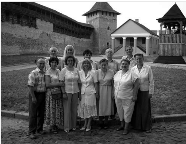
Учасники Волинської обласної науково-етнографічної конференції. Луцьк, 2007 р.