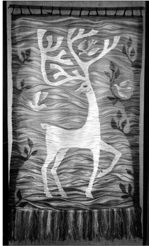
О. Никорак. Гобелен «Карпатський вересень», вовна, гребінкова техніка тkania. Львів, 1979 р.

ся шанувати свою землю, поважати старших, переїмали любов до праці й місцевих народних ремесел. До родинних традицій належало плекання художніх