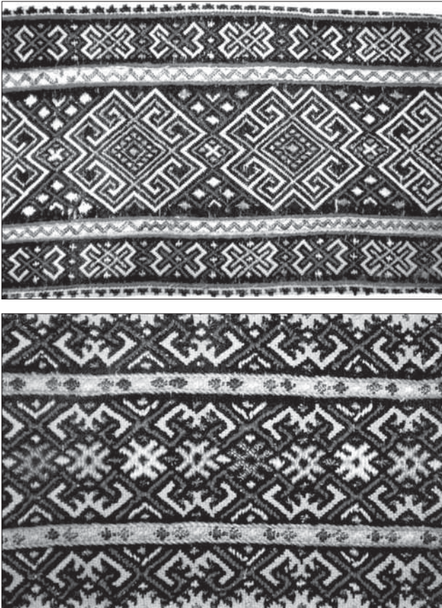
Уставки жіночих сорочок із с. Кобилецька Поляна Рахівського району. Домінуючі мотиви — баранячі різки («вівчарки») та ромб зі сторонами, що виступають («восьмиріг»).

у великобичківській вишивці виділяємо такі: ромб, на зовнішніх сторонах якого вишивали короткі перпендикулярні до боків рисочки («вусики», «ріжки»); ромб із короткими рисочками, загнутими в протилежні боки, на зовнішніх сторонах; ромби з усіченими сторонами; ромби з перехресними сторонами; ромб зі сторонами, що виступають («восьмиріг»). Колоритним та архаїчним було поєднання ромба з іншими геометричними мотивами: восьмипелюстковою розетою, прямим та скісним хрестами [5; 6; 7; 52, с. 6].