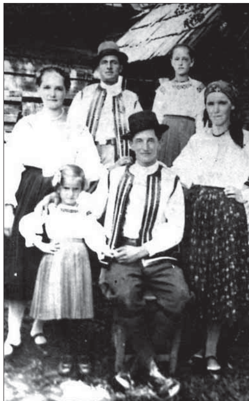
Великобичківська родина. Початок ХХ ст.

Звичайно, пошиттям одягу займались в основному жінки. Вони шили вбрання для всієї родини. Це була досить важка робота. «Її може робити лише така витривала у праці жінка, якою є гуцулка» [13, с. 216]. Гуцули намагались залучати до роботи дітей. Дівчаток змалечку вчили прясти, вишивати. Залучення дитини до виконання певних робіт у гуцулів вважалось важливим фактором формування особистості. Дитина, яка постійно допомагала бать-