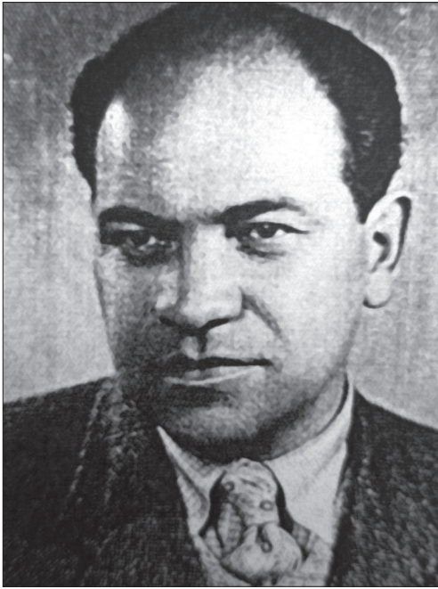
Данило Фіголь. Фото 1947 року

констатував: «Фіголь, як і раніше, любується у штучних вишуканих мотивах... — це його давній жанр, якого він тепер не покидає. Можна б мати заваги тільки щодо технічного виконання його декотрих образів...» [23, с. 813]. В періодичних виданнях [14; 26] того часу було висвітлено майже всі аспекти проведення виставки, автори яких виклали свої рецензії на кожного учасника VII Виставки Української мистецької фотографії. Стосовно Данила Івановича зазначалось: ««Осінь» Д. Фіголя прегарна... дуже багато серця видно з малих котиків «Кізі й Цівуня» (модерно унятих)... Досить емігматичні, загадкові «Відвідини тіней»...» [23, с. 816]. За його участю, закордоном пройшло близько трьох виставок. Данило Фіголь взяв участь в міжнародній фотовиставці в Лос-Анжелосі 1932 р., де за фото «Юдин гріш» отримав відзначення — гран-прі [62, с. 143]. Він учасник Першої Всеслов'янської виставки мистецької фотографії в Загребі 1935 року та Чикаго — 1933 року.