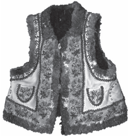
Іл. 10. Кептар «кожушина з цятками». Шкіра, січка, вишивання півхрестиком, стебловим швом, вільною гладдю. 1965 р., с. Топорівці Новоселицького р-ну Чернівецької обл. ПМА за 2007 рік

«подолка». Її вбирали одночасно із сорочкою «станком». Спід «підьтічки» майстри прикрашали стрічковим орнаментом, вишитим бісером (січкою). На Буковинському Поділлі «підьтічку» підточували бісерною «корункою». З 1980-х рр. бісерні мережива стали з'являтися й на новоселицьких «подолках». Декор «підьтічки» та нижньої частини додільної сорочки (в якій «станок» і «підьтічка» становили єдине ціле) були ідентичними [5, с. 550].