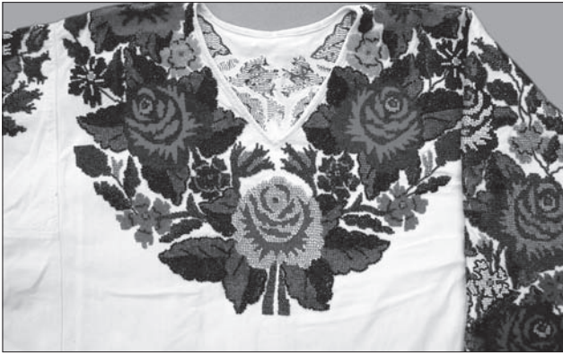
Іл. 8. Сорочка жіноча тунікоподібна додільна. Фрагмент нагрудної вишивки. Полотно, січка, бісер, вишивання півхрестиком. 1970-ті рр. Кіцманський р-ну Чернівецької обл. ПМА за 2008 р.