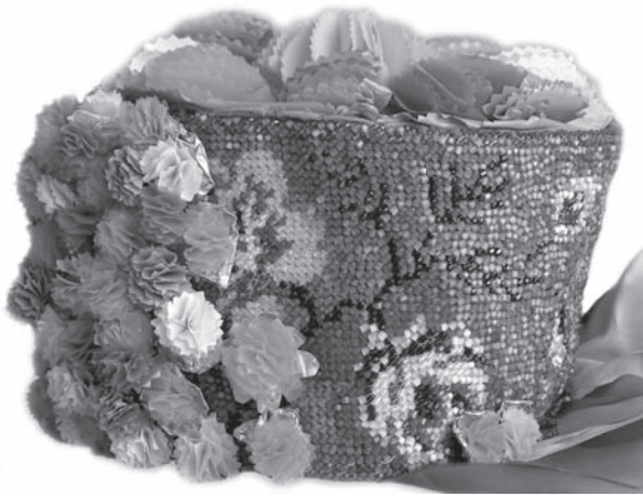
Іл. 4. Весільний вінок «коди». Картонна основа, полотно, січка, вишивання. 1970—1980-ті рр., с. Погорілівка Заставнівського р-ну Чернівецької обл. ПМА за 2007 р.