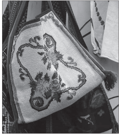
Іл. 12. Тайстра. Платно, бісер, січка, вишивання півхрестиком. 1980-ті рр., с. Топорівка Новоселицького р-ну Чернівецької обл. Львівський вернісаж. Літо 2013 р.

Характерологічною ознакою буковинської сорочки стали рослинні мотиви великих розмірів, що надали загальній композиції твору досі не типової монументальності. Серед вишитих бісером композицій найбільшого поширення набули стилізовані рослинні мотиви з геометризованими формами, яким за ра-