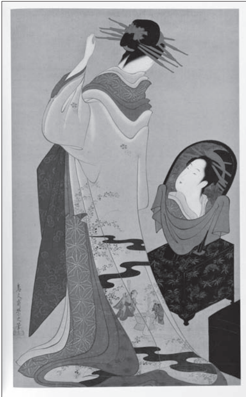
Іл. 1. Чьобунсай Ейші. Жінка біля туалетного столика. Су-вій. 94,2 x 34,8. Шовк, фарби. Кін. XVIII — поч. XIX ст. Музей мистецтва та ремісництва Азабу, Токіо