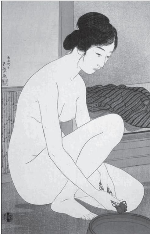
Іл. 8. Хачігучі Гойо. Жінка у лазні. Шін-ханга, кольорова ксилографія. 1915