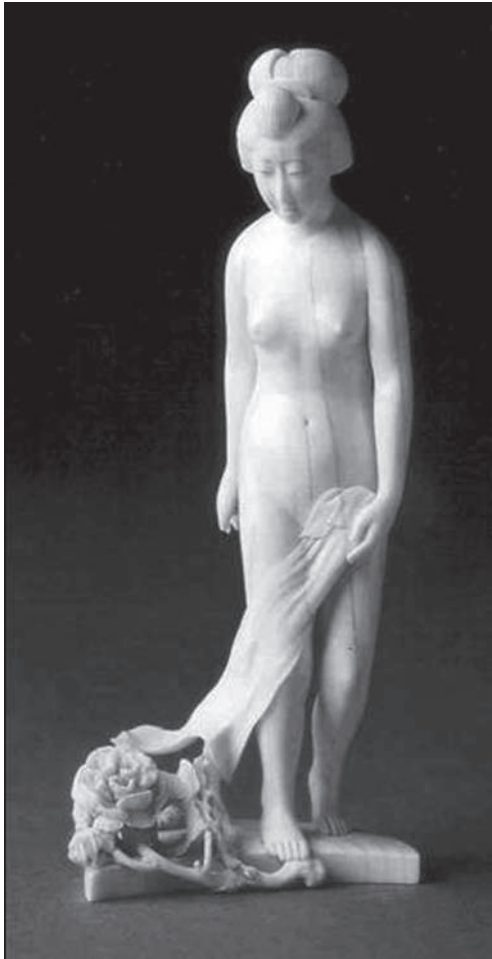
Іл. 5. Сенкей. Оголена Майко. Окімоно. Н 20,7. Слонова кістка. 1880. Приватна колекція, Лондон