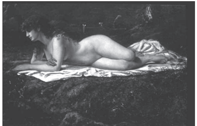
Іл. 3. Ямамото Хосюї. Оголена. 83 x 134,4. Полотно, олія. 1880. Музей мистецтв, Гіфу

Робота виконана в 1880 р. під час навчання в Парижі й повністю відповідає вимогам академічного напрямку, що сповідував його вчитель: пластичність пози, м'яке ліплення форми, делікатна манера роботи пензлем, ледь помітні тональні та колористичні переходи, зефірно-рожева плоть контрастує з насиченим за кольором та тоном тлом... Після повернення до Японії художник продовжував працювати у західному стилі, але звертався до традиційних мотивів.