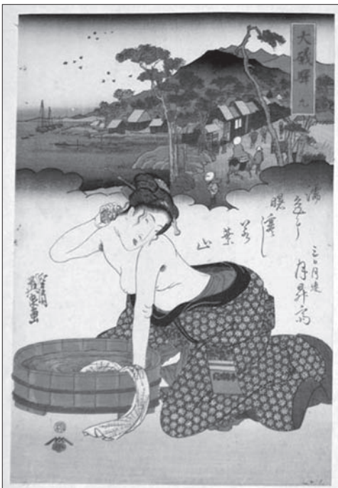
Іл. 2. Кейсай Ейсен. Туалет красуні. Кольорова ксилографія. Перша пол. XIX ст.

самий побіжний огляд творів японського мистецтва виявляє відсутність оголеного тіла серед об'єктів, що