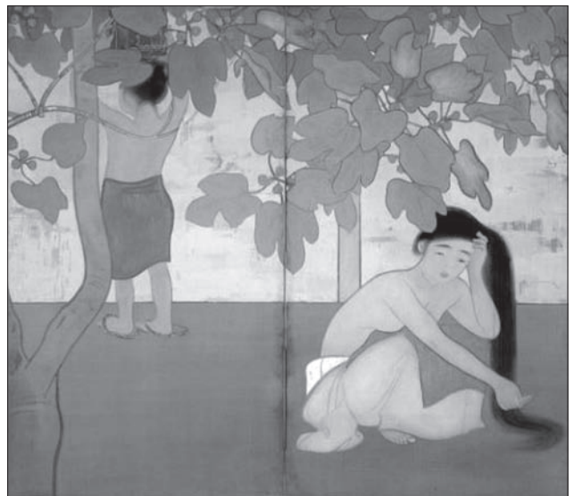
Іл. 7. Цучіда Бакусен. Жінки островів. Ширма (2 частини). 1665 x 1840. Шовк, фарби. 1912. Національний музей сучасного мистецтва, Токіо

жіночого тіла давніх часів? І досі можна зустріти жінок з таким тілом серед старих пані із традиційних родин та гейко» [11].