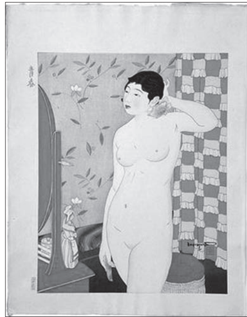
Іл. 10. Ішікава Торадзі. Серія 10 видів оголених жінок. Шін-ханга, кольорова ксилографія. 1934

Оголена модель в японському мистецтві першої третини XX ст.: образотворчі аспекти. Повертаючись до тези Асакура Фумьо про неперевершену красу японської жінки, відзначимо, що сам майстер студіював оголену натуру та відтворював у бронзі красу японських жінок. Щоправда, з тих творів до нашого часу майже нічого не збереглося: між 1941 та 1945 рр. багато з його бронзових скульптур було переплавлено для потреб війни. Значно краще збереглися гравюра та живопис того часу, які красномовно свідчать, що поширення напівоголених моделей в живописі національного спрямування в 1920—1930-ті рр. було до певної міри проявом самоствердження. Однак такі зображення, як і в ми-