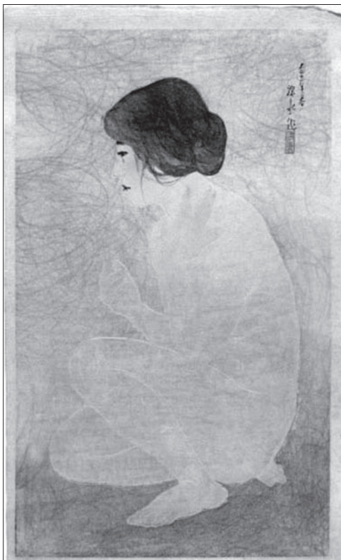
Іл. 9. Іто Шінсуй. Купання. Шін-ханга, кольорова ксилографія. 1922

ських жінок у творах художників японського напрямку ( ніхонга ). Російський вчений Олександр Меццєряков слушно зауважує, що ейфорія, спричинена успіхами модернізації та, особливо, перемогами в японо-російській війні, зумовила появу сентенцій про несуттєвість расових розбіжностей [4].