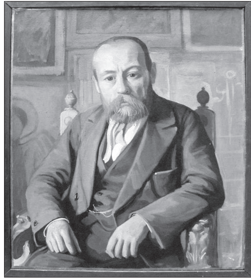
Ю. Магалевський. Портрет І. Свенціцького. 1921 р. П., о. 70 x 60. Національний музей українського мистецтва ім. А. Шептицького. Львів. ІН 30416. Ж-378

Що спонукало Ю. Магалевського до такого рішучого і незвичайного кроку? Ось як пояснює він сам у своїх спогадах: «З початком революції 1917 р., коли на Україні всі творчі елементи кинулись до усвідомлюючої і організаційної праці, в масах українського народу, приспаного царатом, той рух набрав колосального розгону. Дві справи лише висовувалося — національність і власна держава... Героїчна армія, селянські маси і невідомі герої спосеред цивільної людности, як то: громадські діячі, священники, учителі, інженери, адвокати, урядовці та інші — ось був той «нарід», який, не зважаючи ні на що, з посвятою, робив своє велике діло самовизволення...» [7, с. 41—42]. Ю. Магалевський не відділяв себе від того народу, про який говорив, і прагнув робити те саме «велике діло», з самовідданістю присвятивши йому свій фах художника. Він прагнув бути поруч із борцями за незалежність і державність, аби змалювати портрети справжніх реальних героїв у реальних умовах і зберегти ці образи для історії, а потім створити історичні полотна на теми цих подій на зразок «Запорожців...» свого учителя І.Ю. Рєпіна. Він пройшов із Армією УНР через усі фронти. Лише дійшовши до Кам'янець-Подільського художник виконав 150 портретів осіб командного та рядового складу Армії УНР. Він писав: «На сховок до університету я передав 150 портретів різних величин, олійною фарбою, з осіб, що грали ролю в подіях того часу..., кілька десятків зарисованих пам'яток стародавнього