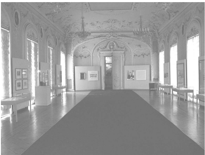
Временная выставка “Хранитель Эрмитажа. К 100-летию со дня рождения И.Г. Спасского (1904–2004)”. Фойе Эрмитажного Театра. 2004 г.