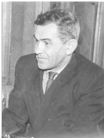
И.Г. Спасский. 1960-е гг.