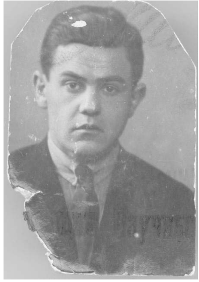
И.Г.Спасский. Начало 1930-х гг.