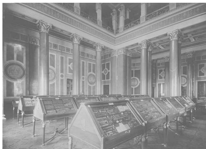
Показательная выставка Отдела нумизматики Государственного Эрмитажа в Двенадцатикилонном зале Нового Эрмитажа. 1930-е гг.