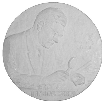
Козлов А.В. Медальон в честь И.Г. Спасского. Гипс. 1974 г. (уменьшено)