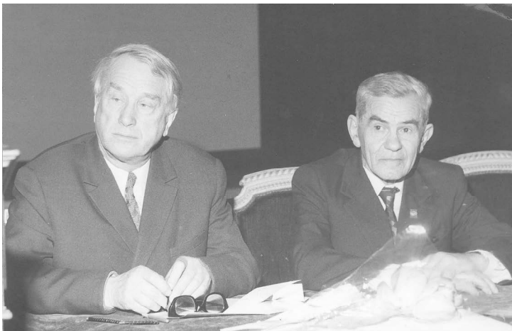
Директор Государственного Эрмитажа Б.Б. Пиотровский и И.Г. Спасский на торжественном заседании в Эрмитажном Театре, посвященном 70-летию И.Г. Спасского. 1974 г. (вверху справа)