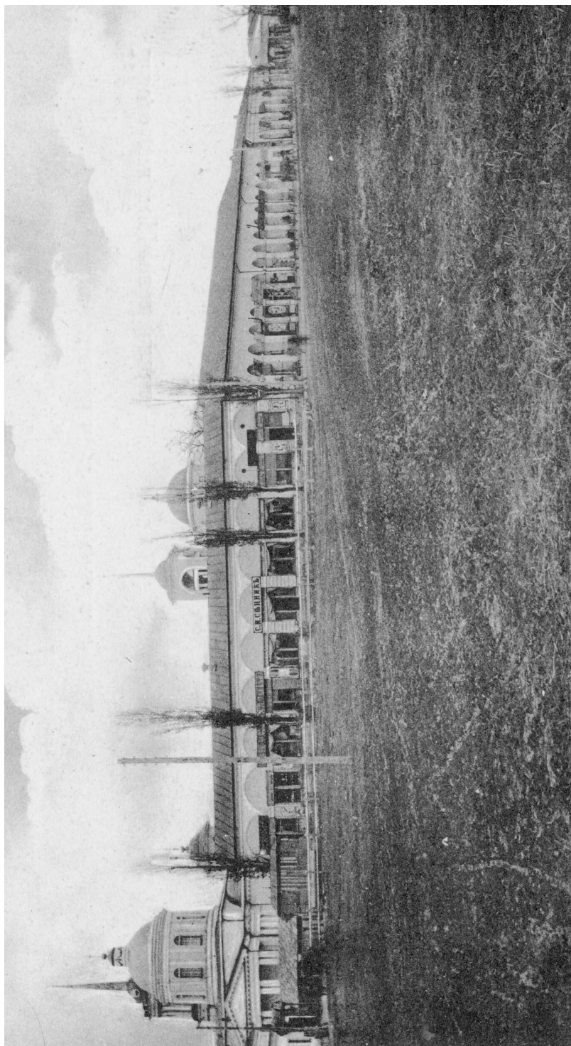
Соборна (Торгова) площа Ніжина на початку XX ст. (листівка з колекції К.І. Ягодовського (Чернігів), уміщена в книзі П.П. Моціяки “Ніжинський історико-філологічний інститут князя Безбородька у портретах його директорів” (Ніжин, 2011))