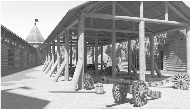
“Сарай для гармат”. Реконструкція.

Результатом регламентації була поява в містах щільних смуг забудови з майже суцільним фронтом будинків [30, с. 24]. В такому вигляді на реконструкції відтворене внутрішнє планування Верхнього Замку, в цілому воно співпадає з розплануванням цієї території середини XVIII ст., коли замість ізб у Верхньому Замку розташовувалися цейхгаузи.