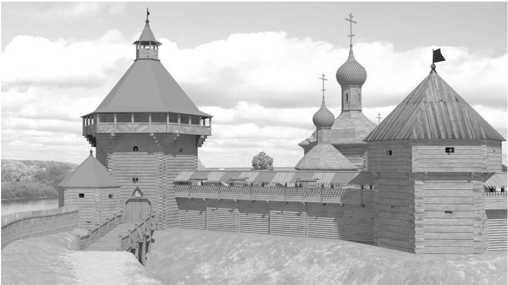
Вид Верхнього замку з боку проїзної вежі. Реконструкція.

У замку зберігалися великі запаси продовольства, які могли б забезпечити потреби не тільки гарнізону, але й польової армії. Для цього використовувалися 4 житниці, “большой анбар” і 11 зернових ям, які вміщували кілька сотень тон зерна [17, с. 91]. За основу реконструкції “большого анбару” взяті малюнки житниць із абрису Тобольська. Вони представляють собою велику двоповерхову споруду з вузьким верхнім ярусом [19, с. 20–21], що слугував для завантаження зерна та вентиляції. Будівлі подібного типу існували до ХХ ст. Схожу конструкцію має “каретний двір” у садибі Дараганів у м. Козелець на Чернігівщині. Менші житниці відтворені за зразками комор російських міст ХІХ – початку ХХ ст. Для зберігання надлишкових обсягів зерна використовувалися зернові ями. Одна з таких ям була розкопана автором даного дослідження із зовнішнього боку замкового рову в Чернігові. Вона мала грушоподібну форму, глибина