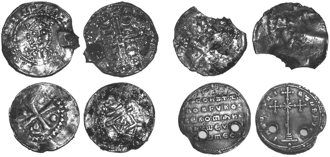
Монети раннього Середньовіччя