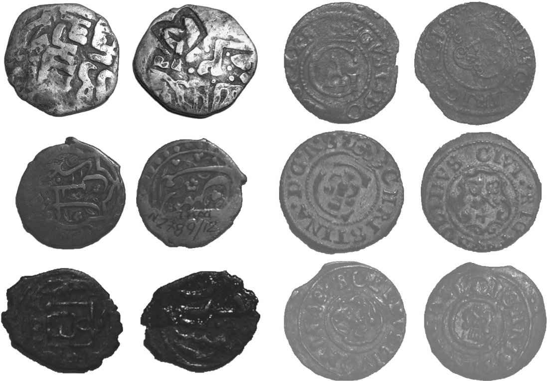
Золотоордынські монети з колекції Трубчевського краєведчого музею