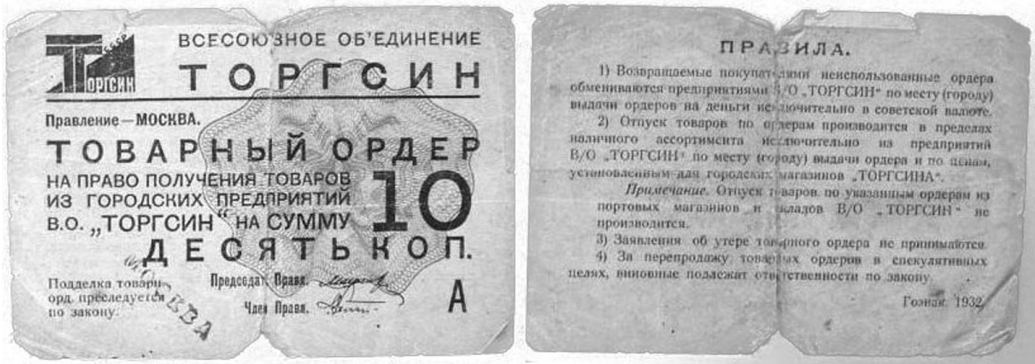
Рис. 1. Товарний ордер "Торгсин" першого випуску номіналом 10 коп.

В обмін на здані цінності покупець у Торгсині одержував короткострокові паперові зобов'язання, які ходили лише в межах торгової мережі об'єднання, а також на "чорному" ринку. Спочатку в якості платіжних засобів використовувалися квитанції Держбанку про переказ чи розмін валюти, чеки іноземних банків тощо. Лише напри-