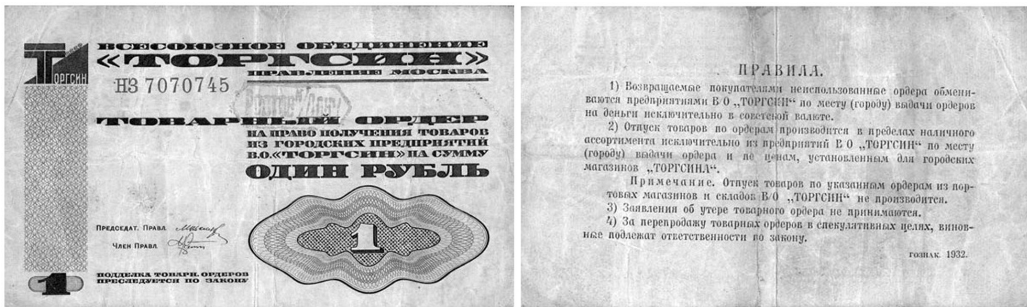
Рис. 2. Товарний ордер “Торгсин” другого випуску номіналом 1 руб.

У квітні – травні 1933 р. у торгових пунктах об'єднання та місцевих періодичних виданнях з'явилися об'яви про припинення прийому ТОТ'ів і перехід на розрахункові