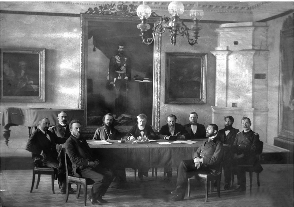
Засідання Правління Ніжинського історико-філологічного інституту князя Безбородька. Фото початку ХХ ст.