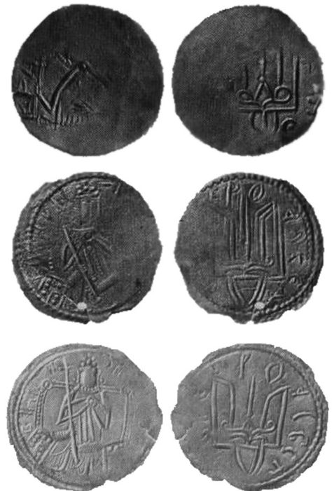
Срібники з Ніжинського (Магерського) скарбу 1853 р., що знаходилися до початку 1930-х років у складі нумізматичного зібрання в Ніжині. Нині перебувають у фондах Державного Ермітажу (м. Санкт-Петербург, РФ)