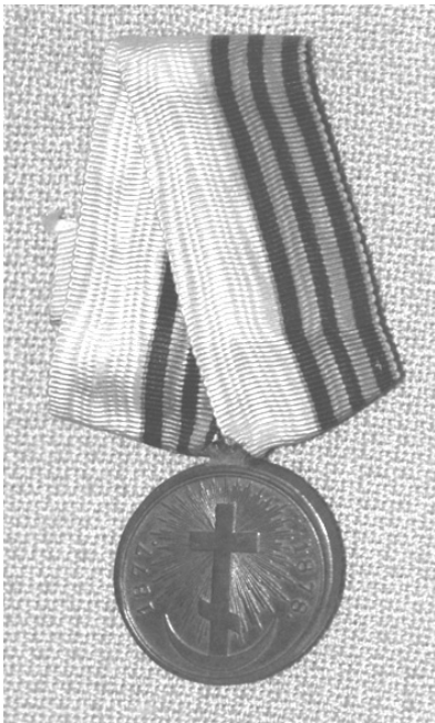
Медаль «В память Русско-турецкой войны 1877–1878 гг.» (Нн-271)

Друга російсько-турецька війна припала на 1877–1878 роки Військовий конфлікт спричинило повстання в Боснії та Герцеговині в 1875 р., яке поширилося на територію Болгарії, Сербії, Чорногорії та Македонії. Влітку 1876 р. Сербія та Чорногорія оголосили султанові війну. Конфлікт неможливо було вирішити без втручання західноєвропейських держав і Російської імперії, яка в 1877 р. оголосила війну Османській імперії й успішно її провела під гаслом допомоги братньому християнському слов'янському народу.