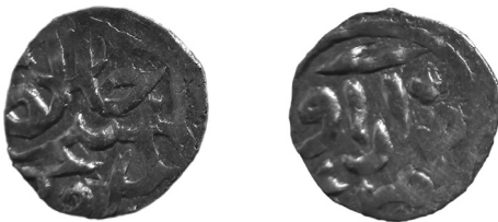
Рис. 3 (а, б) Данг хана Абдаллаха (тип 764 р.х., карбований у м. Азак у середині 1360-х років)