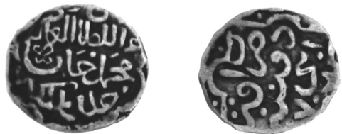
Рис. 6 (а, б), 7 (а, б) Данги Мухаммеда, карбовані в Орді 772 та 773 р.х.