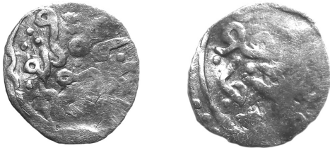
Рис. 10 (а, б) Данг хана Тимур-Кутлуга (тип 796 р.х., карбований у м. Крим у 1394 р.)