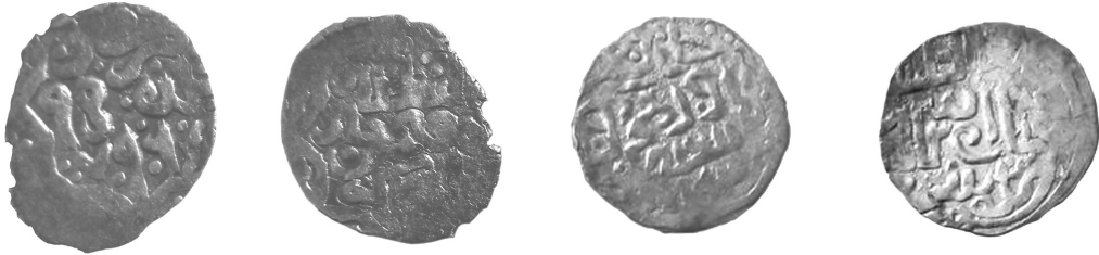
Рис. 9 (а, б) Данг хана Токтамиша (тип 796 р.х., карбований у м. Крим у 1394 р.)

У 2011 р. поблизу селища Вороніж Шосткинського району (у минулому Глухівського повіту) були знайдені 4 монети золотоординського періоду – «сіверські наслідування» джучидських дангів хана Мухаммеда-Буляка (Рис. 12 (а, б), Рис. 13 (а, б), Рис. 14 (а, б), Рис. 15 (а, б)). Їх вага не встановлена, на двох добре видно «княжий знак». Монети з по-