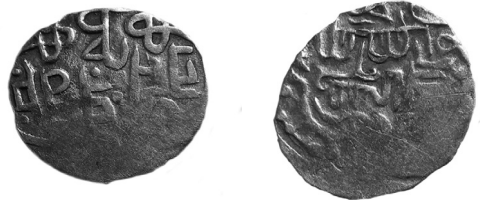
Рис. 5 (а, б) Дзеркальне наслідування данга хана Мухаммеда-Буляка (тип 773 р.х., карбований на території Чернігово-Сіверщини в 1370-х роках)