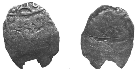
Рис. 8 (а, б) Наслідування кримському дангу хана Девлет-Берди (1421(1422?) – ?)