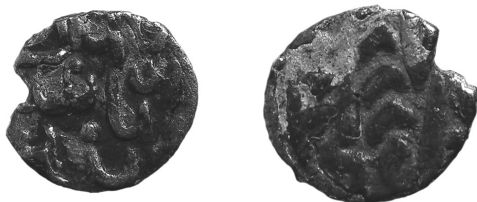
Рис. 4 (а, б) Данг Абдаллаха карбування Орду Муаззам 766 р.х.