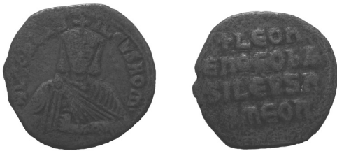
Рис. 1 (а, б) Мідний фоліс візантійського імператора Лева VI (886–912)