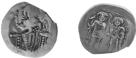
Рис. 2 (а, б) Золотий гіперпірон візантійського імператора Феодора II Ласкаріса (1254–1258)