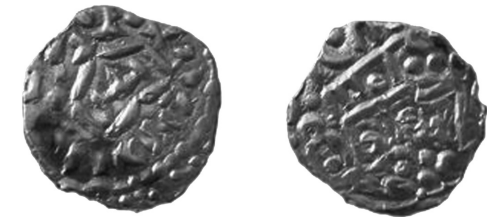
Рис. 12 (а, б), 13 (а, б), 14 (а, б), 15 (а, б) Сіверські наслідування джучидських дангів хана Мухаммеда-Буляка (1370–1372)