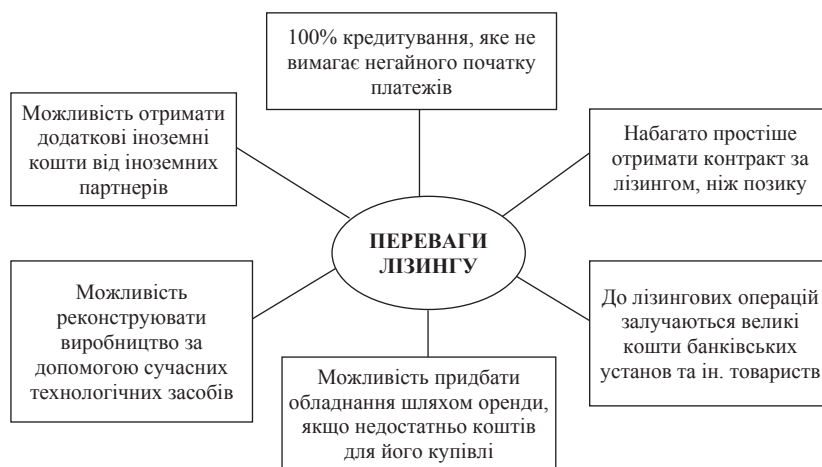
Рис. 3. Переваги лізингу для малих промислових підприємств

Так, у 2013 р. загальний обсяг залученого венчурного капіталу у США склав більше 23 млрд. дол. США, в Європі – більше 5 млрд. дол. США, з них Великою Британією залучено 822,7 млн., Францією – 461,1 млн., Німеччиною – 311,8 млн., Швецією – 155,4 млн., Данією – 167,8 млн. дол. США [11]. Аналіз статистичних даних дав змогу виявити лідируючі позиції підприємств машинобудування у сфері інноваційної венчурної діяльності малого бізнесу. У США близько 40% за кількістю угод та обсягів венчурного інвестування займають галузі машинобудування. При цьому на інвестування пізніх етапів та