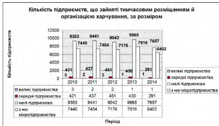
Рис. 2. Кількість підприємств, що займають тимчасовим розміщенням та організацією харчування, за розміром