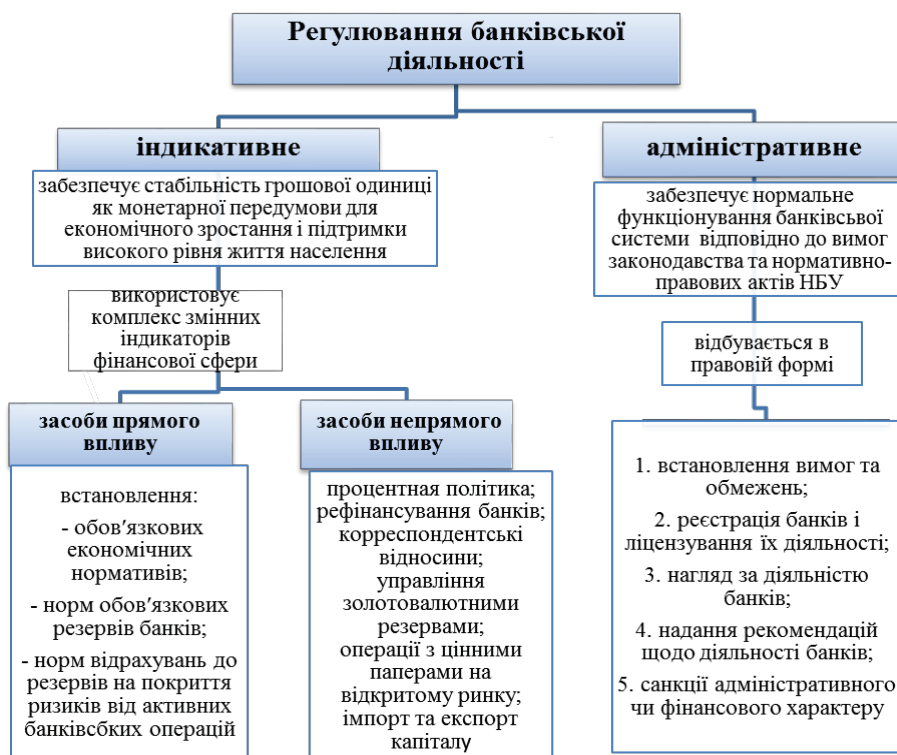
Рис. 1. Форми регулювання банківської діяльності

Базельські принципи – не закон і не догма. Країни самі вирішують, які принципи і якою мірою вводити в національне законодавство, що регулює банківську сферу. Принципи розробляються як мінімальні вимоги до країн, органів державної влади та учасників банківської діяльності, спрямовані на зміцнення і стабільність світової банківської системи.