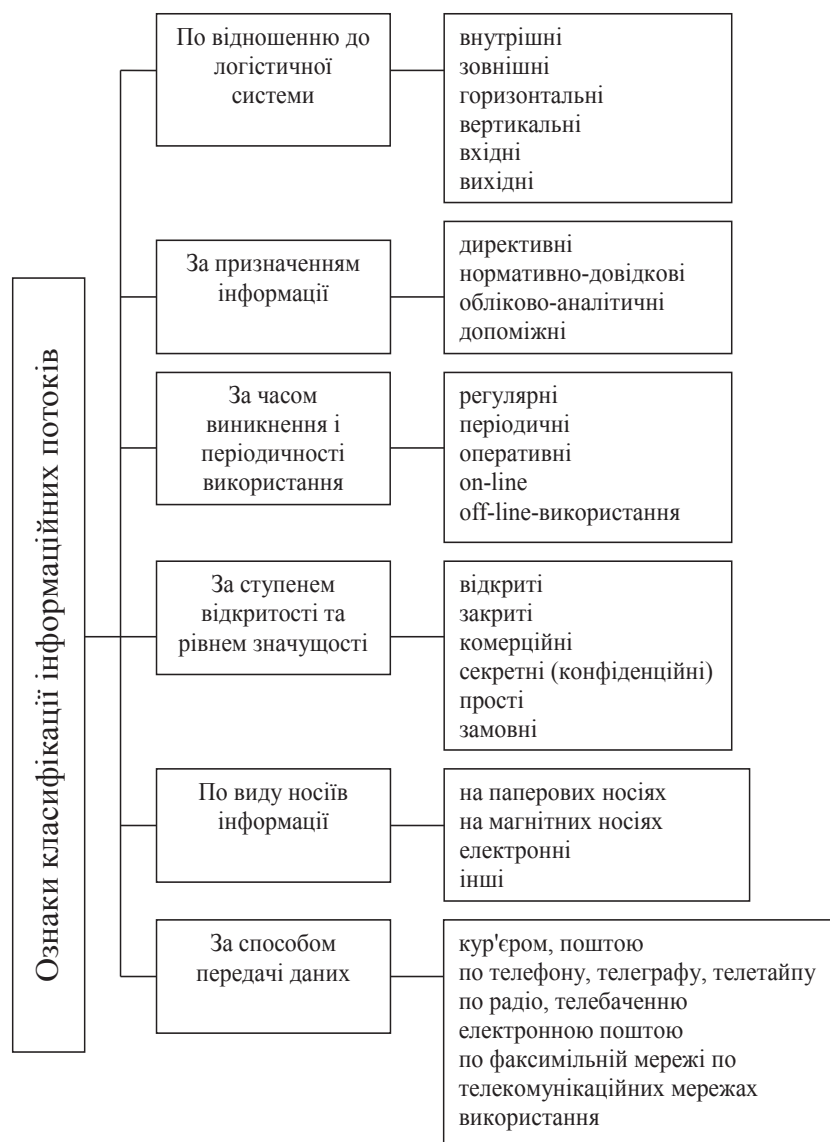
Рис. 1. Класифікація інформаційних потоків [2]