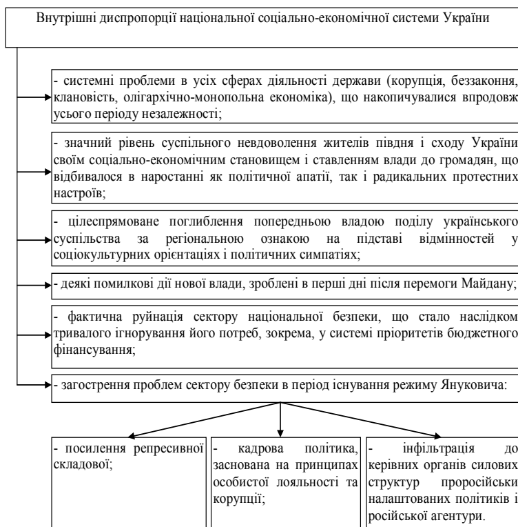
Рис. 1. Внутрішні диспропорції національної соціально-економічної системи, що призвели до ескалації конфлікту на Сході України [2; 3]

Увесь 2014 р. економічна система України вимушено функціонувала в несприятливих умовах. Зовнішня агресія завдала Україні невинуватих втрат і спричинила серйозні деструктивні процеси, зокрема, це: руйнація інфраструктури на території проходження бойових дій, втрата виробничих зв'язків і відсутність поставок ресурсів, часткова втрата зовнішніх ринків та зниження експортного потенціалу. У той же час таке необхідне для країни реформування залишилося нереалізованим, хоча окремі зміни і відбувалися, проте дуже повільно.