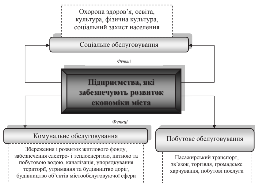
Рис. 1. Класифікація підприємств, які забезпечують розвиток економіки міста за функціональною ознакою

Важливим є те, що правильно впливати на доцільність виробничих процесів допомагає