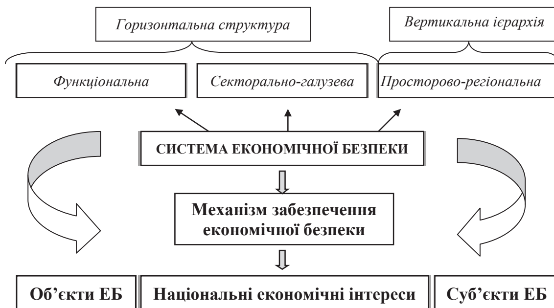
Рис. 1. Комплексна система економічної безпеки

Термін «механізм» у сучасних наукових дослідженнях економічного спрямування є достатньо розповсюдженим, зазви-