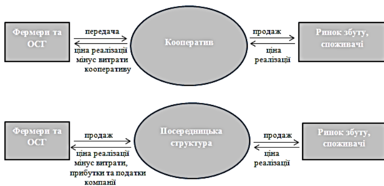
Рис. 1. Економічна сутність діяльності кооперативу

1. Ведуть до стабільного процвітання сільськогосподарських товаровиробників. Завдяки збільшенню прибутку, отриманого за рахунок кооперативу, у виробників з'являється як мотивація, так і необхідні засоби для розвитку виробництва. Забезпечення матеріально-технічними ресурсами і надання послуг кооперативів сприяє зростанню продуктивності аграрного виробництва. Завдяки послугам, які надають обслуговуючі кооперативи,