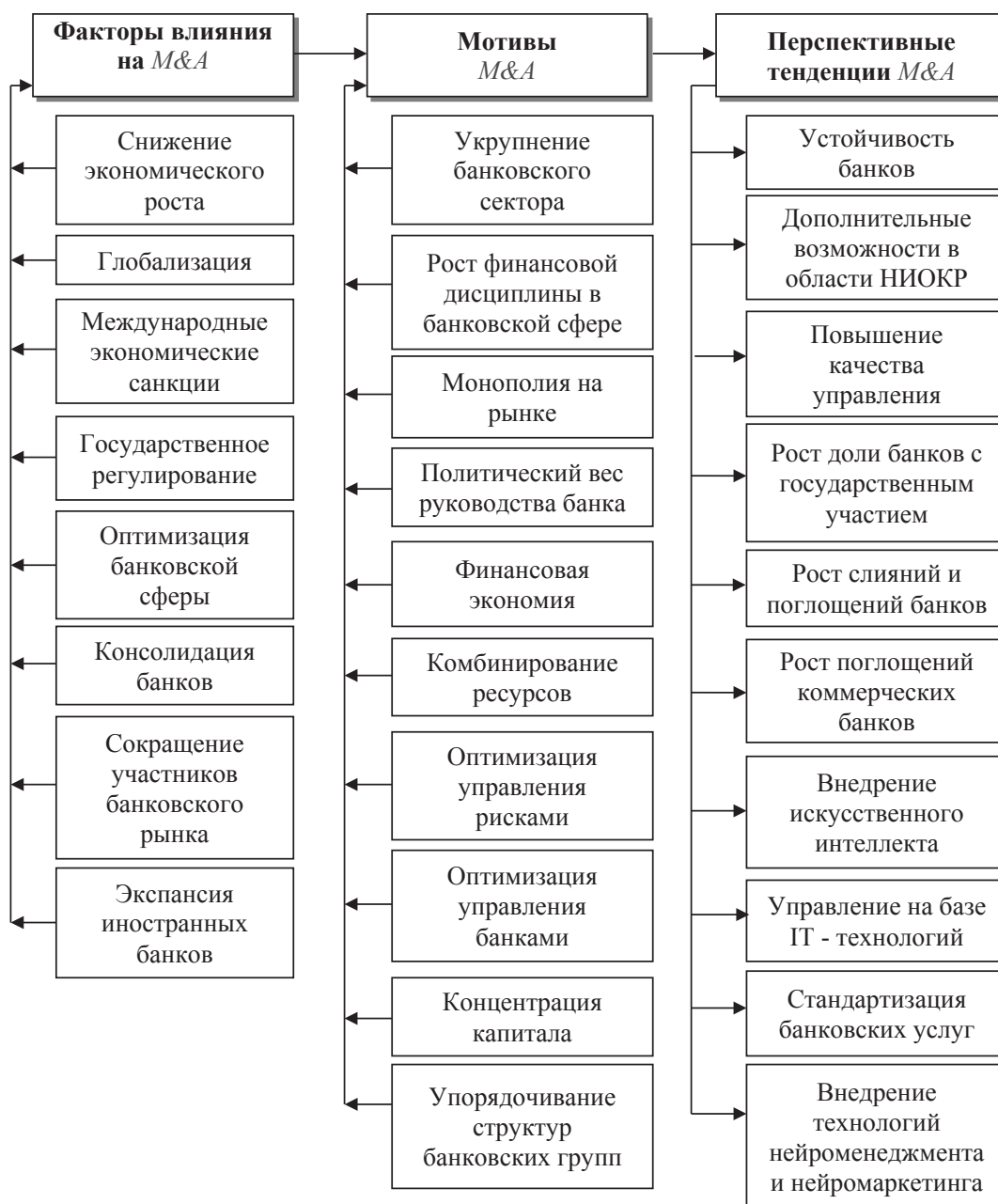
Рис. 2. Влияние ключевых факторов и мотивов на формирование перспективных тенденций M&A в российском банковском секторе

Анализ основных факторов и мотивов слияний и поглощений в банковском секторе Российской Федерации позволяет систематизировать перспективные тенденции развития рынка M&A (см. рис. 2).