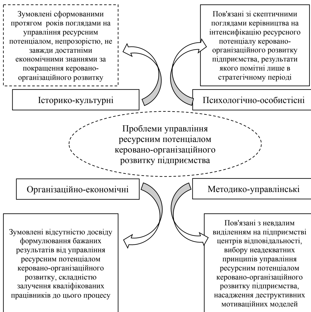
Рис. 3. Проблеми управління ресурсним потенціалом керовано-організаційного розвитку підприємства

Управління ресурсним потенціалом керовано-організаційного розвитку підприємства спрямоване на встановлення параметрів, що визначають широкий спектр альтернативних дій щодо вирішення протиріч, неузгодженості між цілями підприємства, наявними ресурсами та впливом зовнішнього і