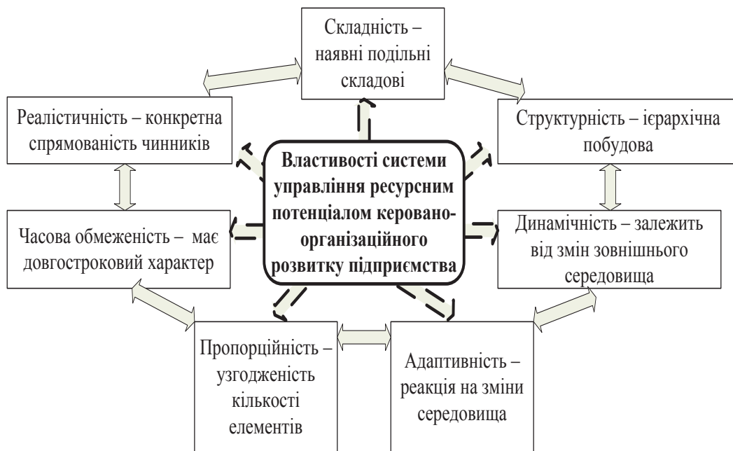
Рис. 2. Властивості системи управління ресурсним потенціалом керовано-організаційного розвитку підприємства