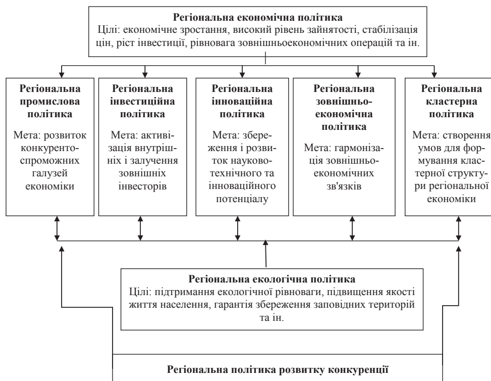
Рис. 2. Ключові елементи регіональної економічної політики