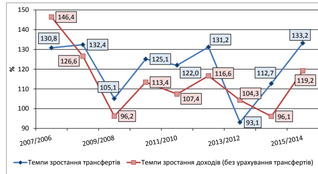
Рис. 3. Темпи зростання трансфертів та доходів місцевих бюджетів за 2007-2015 роки

Приріст обсягів міжбюджетних трансфертів у 2015 році порівняно з 2014 роком склав 33,2%. Зауважимо, що їх зростання відбувалося вищими темпами, ніж доходів місцевих бюджетів, приріст яких склав лише 19,2% (рис. 3).