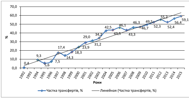
Рис. 1. Динаміка частки міжбюджетних трансфертів у доходах місцевих бюджетів України у 1992-2015 роках