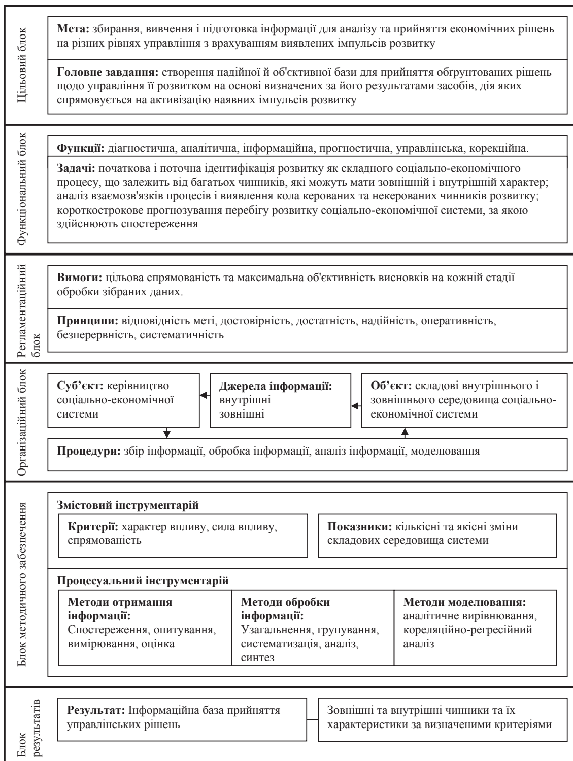
Рис. 1. Методичний підхід до моніторингу визначення чинників розвитку

З огляду на мету моніторингу чинників розвитку соціально-економічної системи, можна виокремити також його головні завдання.