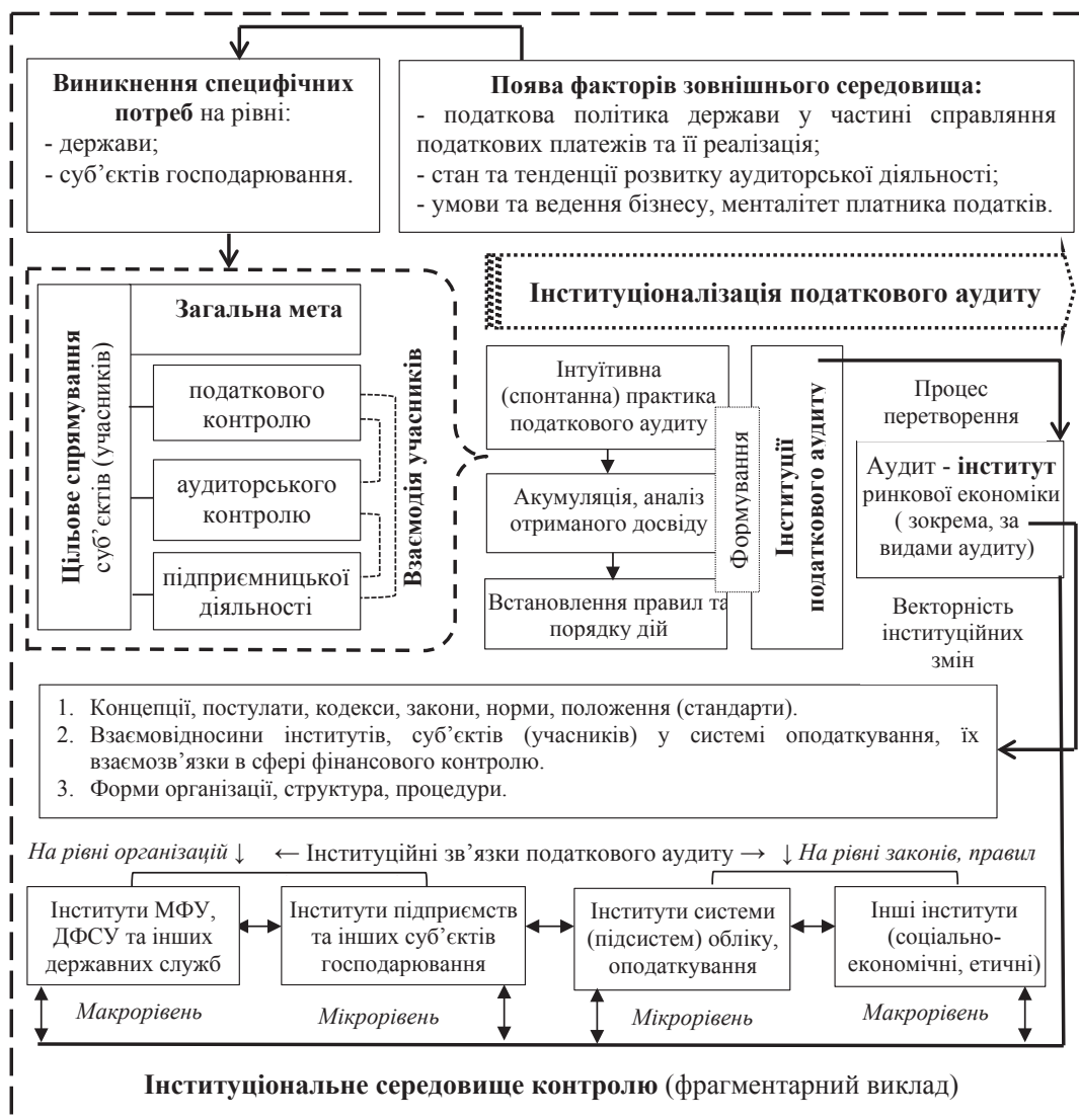
Рис. 2. Етапи інституціоналізації податкового аудиту

ного розвитку контролю цілком імовірна і різна комбінаторика зв'язків (інститут ↔ інституція). У цьому сенсі інститутом (від лат. institutum – устрій, організація, установлення, установа) можна вважати законодавчо регламентовану структуру – закріплену інституцію, яка соціально узгоджена більшістю учасників інституційного процесу. Переконливими здаються визначення інститутів «як твердих структур, які на відміну від «м'яких» інституцій, тільки «затвердівши» в соціальних структурах організацій, передаються і зберігаються» [9, с. 10], та обґрунтування еволюційної ролі інститутів, за допомогою яких реалізуються інституції. Також представляються вмотивованими уявлення інститутів як системи соціальних правил і норм взаємодії агентів, об'єднаних в стійку структуру [9, с. 10], та судження стосовно того, що інституції зменшують невизначеність за допомогою структурування, а інститути зменшують та знімають невизначеність, і саме в цьому полягає функція інститутів [32]. Не можна не відзначити плідність напрацювань Петрик О.А., в яких автор досліджує аудит як інститут ринкової економіки в тривимірній площині: наука, професійна діяльність, напрям підготовки фахівців. У цьому контексті