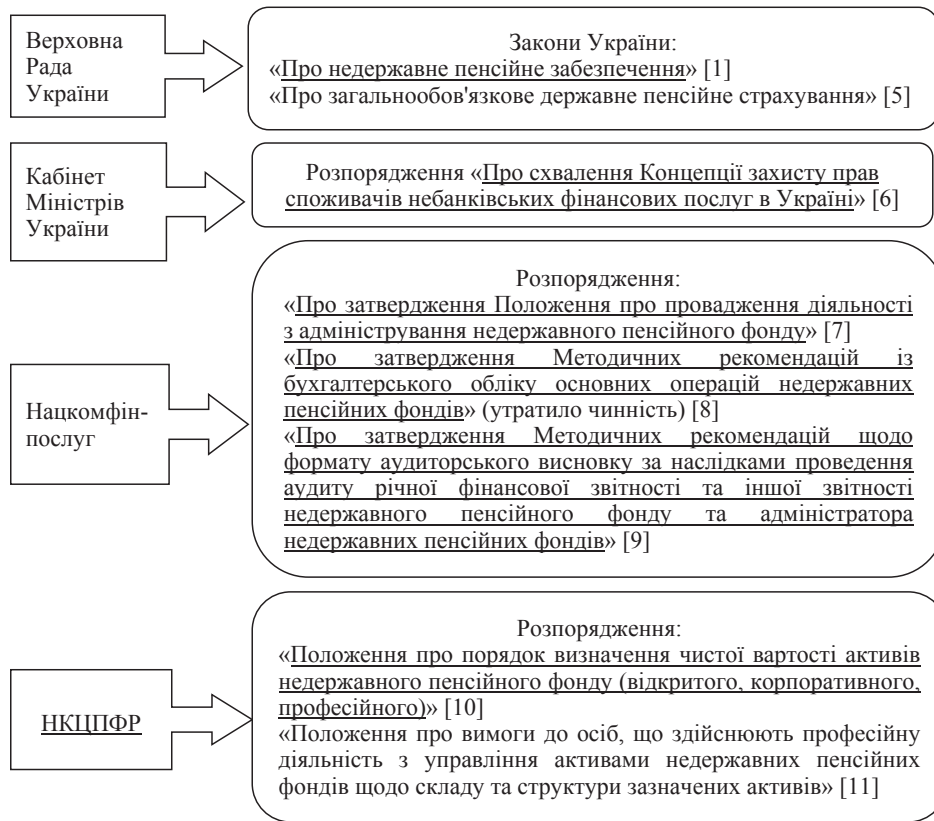
Рис. 2. Основні законодавчі акти щодо регулювання діяльності НПФ

Закон України «Про бухгалтерський облік та фінансову звітність в Україні» [12] визначає правові основи регулювання, організації, ведення бухгалтерського обліку та складання фінансової звітності в Україні. Згідно з ч. 1 ст. 2 Закону України [12], його норми поширюються на всіх юридичних осіб, що створені відповідно до законодавства України, незалежно від