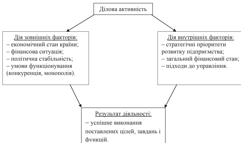
Рис. 1. Основні фактори, що впливають на ділову активність підприємств

Проведені дослідження вченого виявили такі чинники ділової активності промислових підприємств, що негативно впливають на їхню діяльність, як нестабільна політична та економічна обстановка в країні; низький рівень добробуту населення і його дохідного забезпечення; неефективна організація роботи і брак кваліфікованих кадрів; недоліки в законодавчому контролі; складність надання звітів організа-