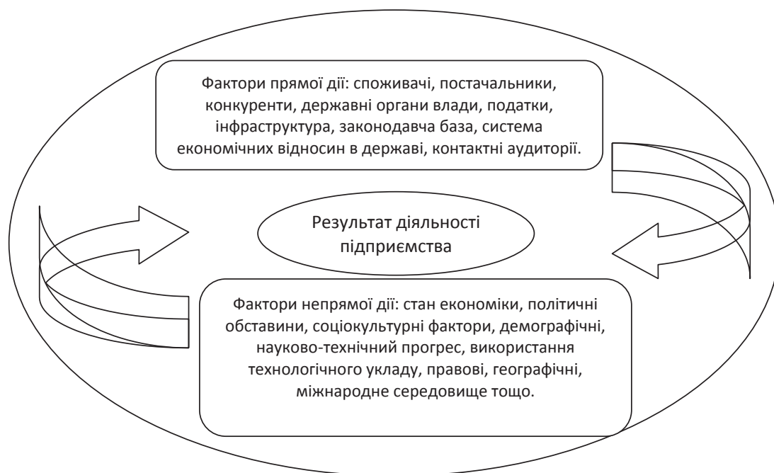
Рис. 1. Система факторів зовнішнього середовища організації

Загалом фактори зовнішнього середовища можна класифікувати за принципом керованості (керовані та некеровані фактори впливу), за ієрархічною будовою (глобального характеру, національні та фактори регіональної відмінності). За джерелами походження фактори можна об’єднати в такі групи, як стан та