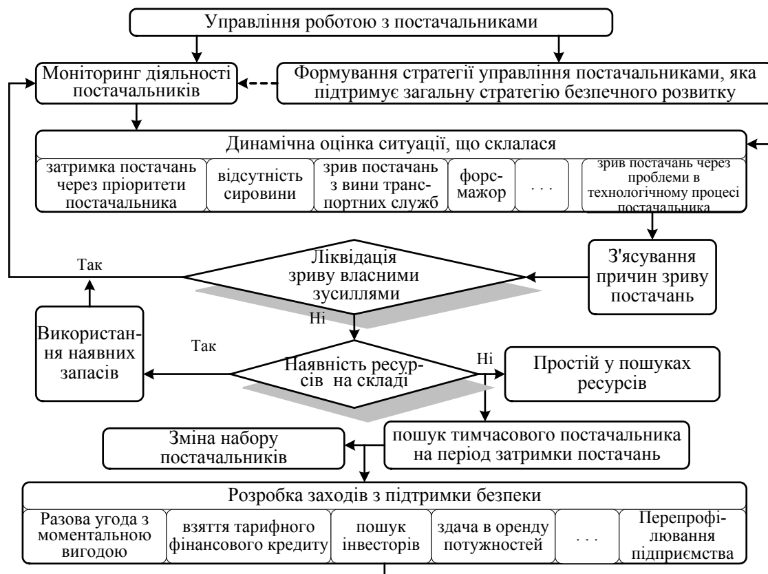
Рис. 3. Моніторинг діяльності постачальників

Під час створення оптимального набору зон стратегічних ресурсів та вироблення стратегії поведінки підприємства на ринку факторів виробництва необхідно оперативно враховувати будь-які можливі зміни ситуації, а протидія загрози неотримання товару-ресурсу від постачальника повинна ґрунтуватися на наявності альтернативних постачальників та можливості вибору з їхнього числа інших основних постачальників товарів-ресурсів.