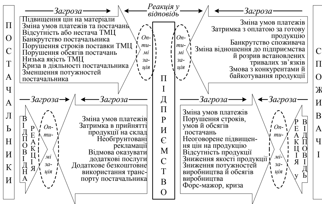
Рис. 1. Схема виникнення загроз під час взаємодії підприємства з контрагентами

Оскільки стосунки з постачальниками ресурсів виступають одним зі значних факторів-загроз, саме раціоналізація політики вибору постачальників й нормалізація подальшої взаємодії з ними повинні стати основою для підтримки достатнього рівня економічної безпеки. Основою для цього повинна стати концепція зон стратегічних ресурсів (ЗСР).