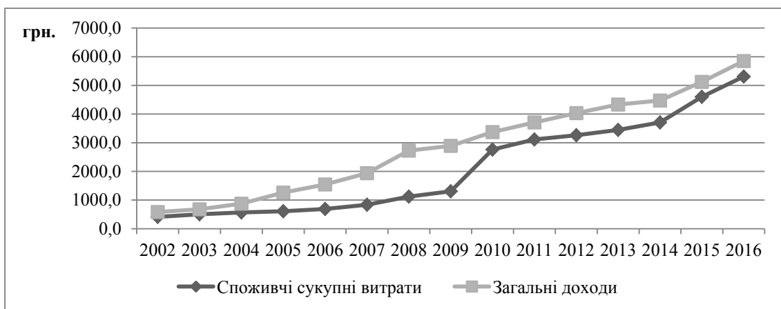
Рис. 3. Загальні доходи та споживчі витрати населення у середньому на місяць на одне домогосподарство