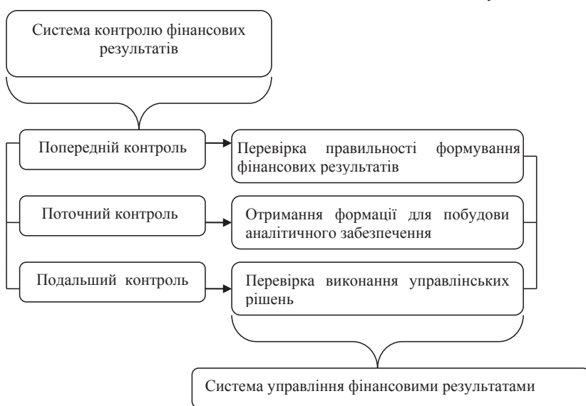
Рис. 1. Види контролю у системі управління фінансовими результатами

Підтримуємо думку М.М. Бенько щодо необхідності проведення контрольних заходів на трьох рівнях: