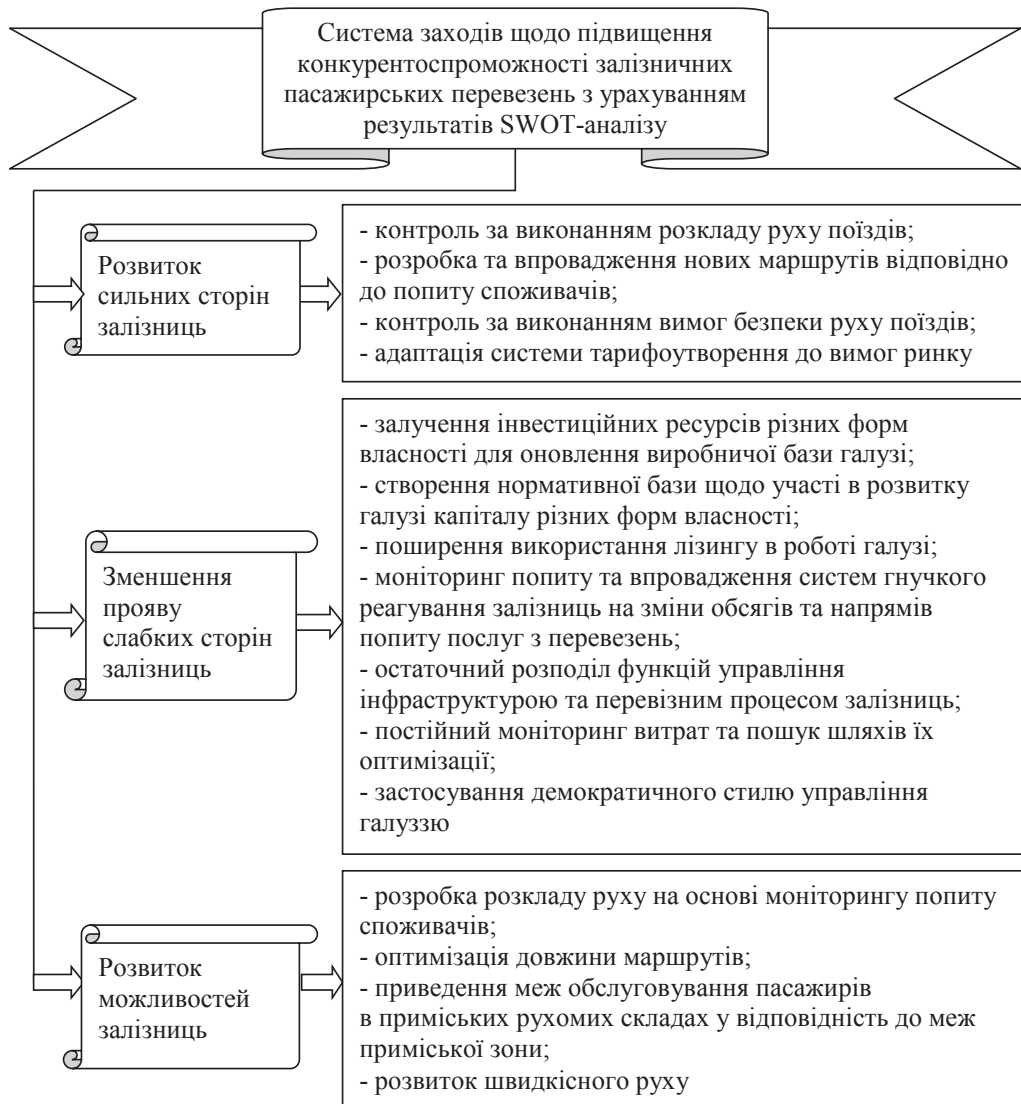
Рис. 3. Система заходів щодо підвищення конкурентоспроможності залізничних пасажирських перевезень з урахуванням результатів SWOT-аналізу

робка розкладу руху з урахуванням інтересів пасажирів, оптимізація маршрутів відповідно до пасажиропотоків та вимог споживачів, розвиток швидкісного руху тощо.