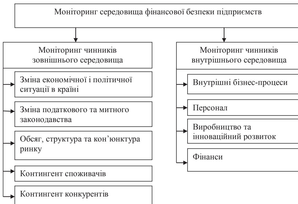
Рис. 1. Структура основних чинників моніторингу середовища обліково-аналітичної безпеки підприємства