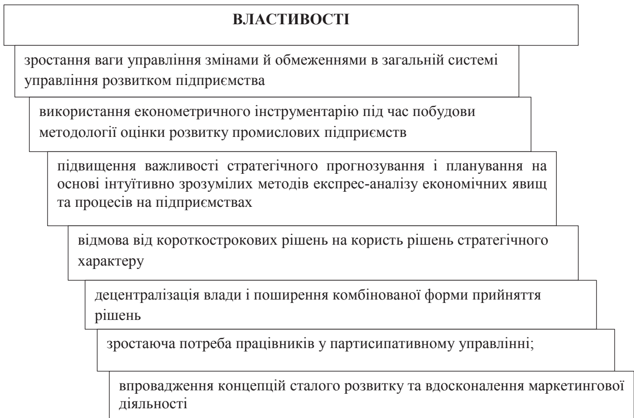
Рис. 3. Властивості, що визначають рівень ефективного розвитку промислового підприємства