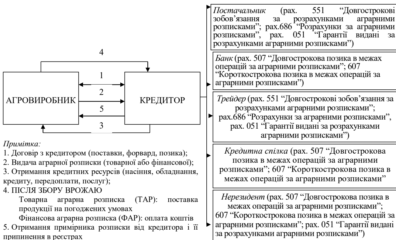
Рис. 2. Загальна модель розрахунків шляхом застосування аграрних розписок

Ураховуючи вищевикладене, на рис. 2 наведемо загальну модель розрахунків шляхом застосування аграрних розписок із метою подальшого приведення прикладів