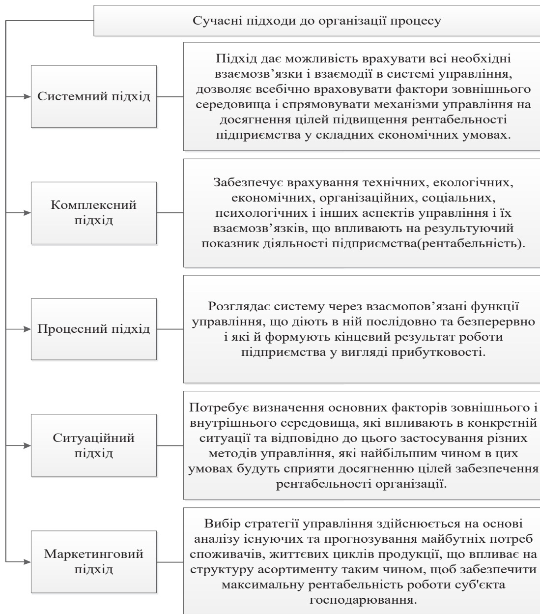
Рис. 4. Сучасні підходи до організації процесу

Визначивши основні етапи управління рентабельністю, охарактеризуємо сучасні підходи до організації процесу (рис. 4).