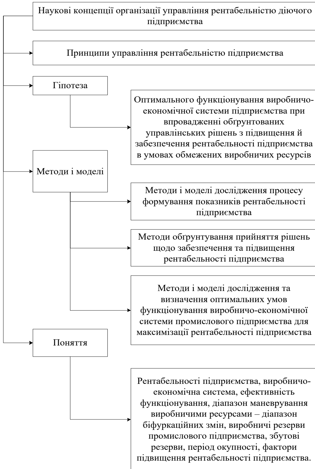
Рис. 5. Наукова основа організації управління рентабельністю підприємства

На рис. 5 систематизовано наукову основу організації управління рентабельністю на підприємстві. Винятково важливу роль у цьому процесі відіграють методи і моделі, зокрема дослідження процесу формування показників рентабельності підприємства, обґрунтування прийняття рішень щодо за-