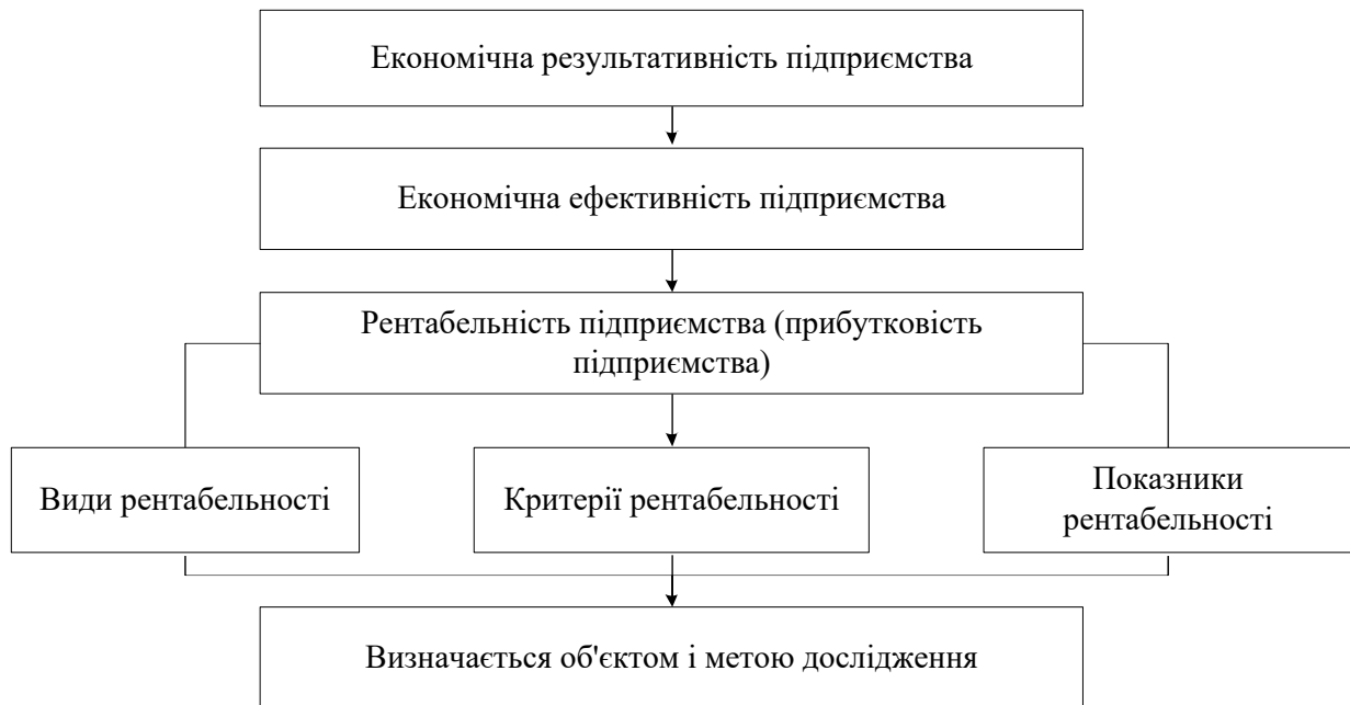
Рис. 2. Місце рентабельності в системі однорідних за змістом економічних категорій, що характеризують діяльність підприємства

занадто багато конкурентів у цю галузь, але їй не потрібним буде втручання органів, що стежать за тим, щоб позиція підприємства в галузі не стала монопольною.