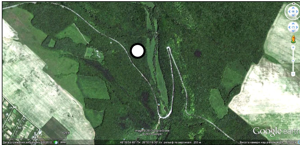
Рис. 1. Схема розташування пробної площі в ландшафтно-ботанічному заказнику «Совий яр» (кружком позначено місце розміщення пасток).

При аналізі структури домінування до видів еудомінантів ( ED ) відносили тих, частка яких від загальної кількості зібраних особин перевищувала 10 %, домінантів ( D ) — складала 5,1–10,0 %, субдомінантів ( SD ) — 1,1–5,0 %, рецедентів ( R ) — 0,51–1,00 % і субрецентів ( SR ) — менше 0,5 %.