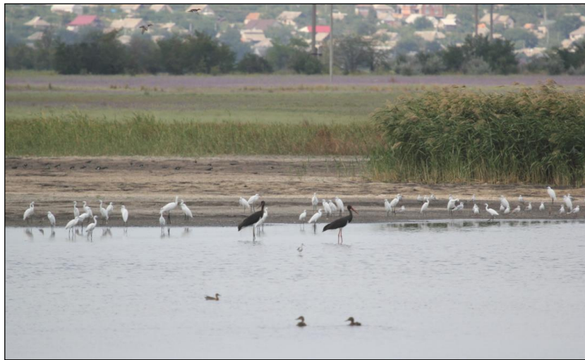
Рис. 2. Чорні лелеки на мілководді р. Молочної – найтипівіше місце перебування виду у Північному Приазов'ї.

Якщо не брати до уваги потенційно гніздових лелек Кримського заповідника (№ 20 у таблиці і на рис. 1) і невизначених за чисельністю птахів на Лебединих островах (відповідно № 16), то з 305 особин (65 зустрічей) – 210 птахів трималися в 12 зграях розміром від 6 до 49 особин і спостерігалися у серпні-вересні, тобто в період осінніх міграцій. Відповідно, 65 лелек по 2-4 птаха відмічалися 25 разів, з яких 2 ос. один раз у квітні, 9 ос. – тричі у травні, 7 ос. – двічі у липні, 30 ос. – 12 разів у серпні та 17 ос. – 7 разів у вересні. Поодинокі птахи зареєстровані 30 разів: 4 у травні, по 1 ос. у червні і липні, 13 у серпні, 4 у вересні та 5 у жовтні, а також ще по 1 особині з не вказаною датою спостереження (№ 6 і № 38 у таблиці і на рис. 1).