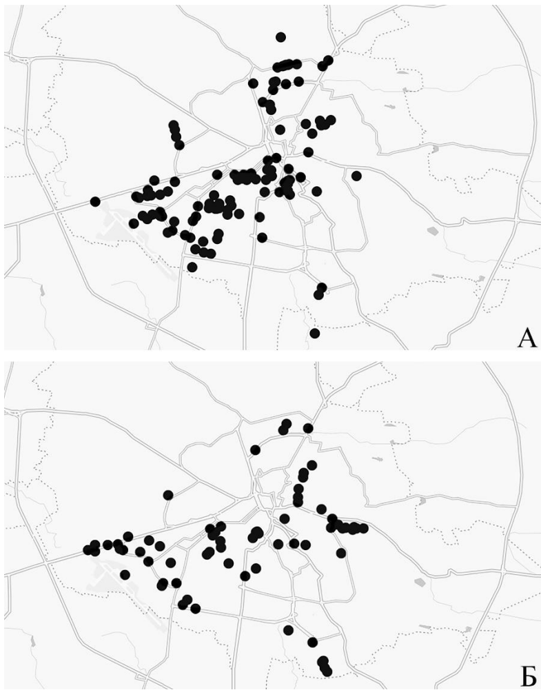
Рис. 3. Обстежені ділянки у Львові, на яких були присутні (А) або відсутні (Б) особини C. hortensis з білими черепашками без смуг.

Таким чином, можна запропонувати наступний алгоритм визначення походження колоній C. hortensis , виявлених на заході України. А) Колонії, утворені виключно нащадками первинної інтродукції, яка відбулася, найімовірніше, у другій половині ХХ ст.: