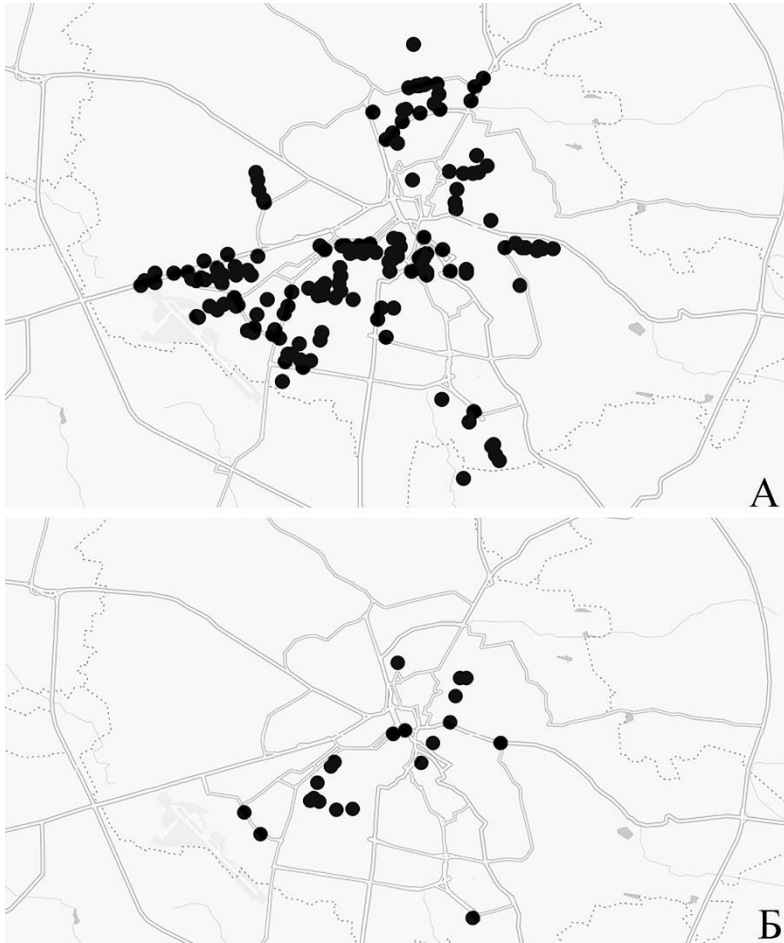
Рис. 2. Обстежені ділянки у Львові, на яких були присутні (А) або відсутні (Б) особини C. hortensis з білими смугастими черепашками.

домінує над світлішим, можна припустити, що білий фоновий колір також є рецесивним по відношенню до жовтого.