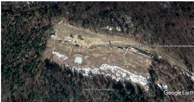
Рис. 1. Вигляд ділянки геологорозвідки станом на 17.03.2019 р.

Основною метою створення ландшафтного заказника «Бориславський» було збереження умов для існування та самовідтворення корінних ялицево-букових, з елементами ялицево-дубових, насаджень Прикарпаття. Однак, як свідчать таксаційні описи, аналізована ділянка була початково позбавлена таких типів деревостанів і була зайнята вторинними синантропними березняками, які й нині прилягають до неї, принаймні в межах вид. 1 кв. 63, де знаходиться більша її частина.