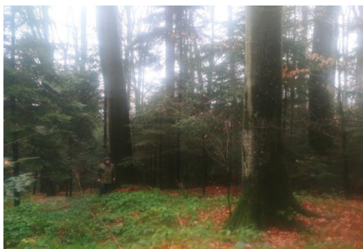
Рис. 3. Високопродуктивне природне ялицево-букове насадження у кв.44, вид 20.

Характеристика ділянки у кв. 44 виділ 20, площею 2,8 га : координати N 49.26181, E 23.41924, категорія – ліси наукового призначення, насадження природного походження, склад 9Бк1Яц, вік 150 років, середня висота 32,3 м, середній діаметр 60,8 см, бонітет I, відносна повнота 0,67, запас 456 м 3 на 1га. Тип лісорослинних умов D3. Наявність підросту складом 8Яц2Бк., віком 20 років. Також наявна повночленна ценопопуляція лунарії оживаючої.